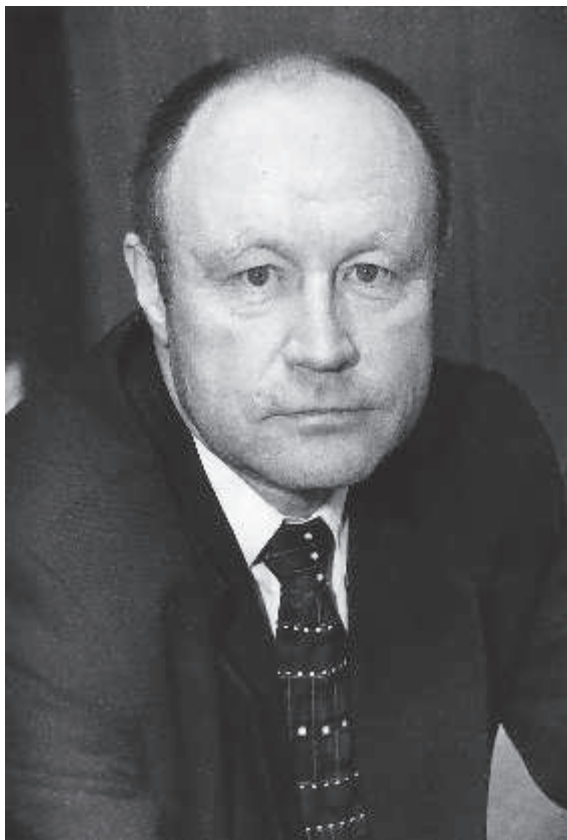
В.В. ЧАГИНСКИЙ, вице-президент Федерального Союза адвокатов России