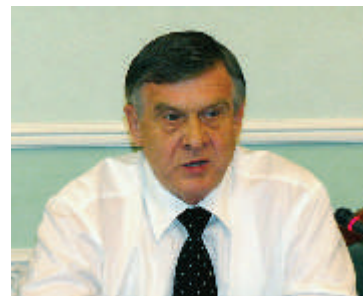
Ю.Г. СОРОКИН, вице-президент Федерального союза адвокатов России, вице-президент Адвокатской палаты Московской области

моуправлении адвокатуры, что серьезно повлияло на разобщенность адвокатуры, на ее профессиональный уровень и на ее эффективность с точки зрения обеспечения квалифицированной юридической помощью граждан России. Необходимо услышать голос адвокатов из всех регионов России. Необходимо знать те проблемы, которые волнуют адвокатов. Итогом этого всероссийского разговора адвокатов должна стать выработка направления и пути дальнейшего совершенствования и развития российской адвокатуры.