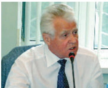
Н.Н. КЛЁН, первый вице-президент Международного Союза (Содружества) адвокатов, председатель Межреспубликанской коллегии адвокатов