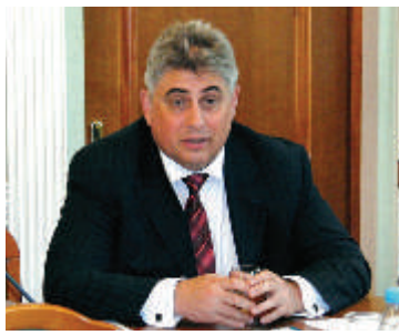
И.С. ЯРТЫХ, первый вице-президент Федерального союза адвокатов России