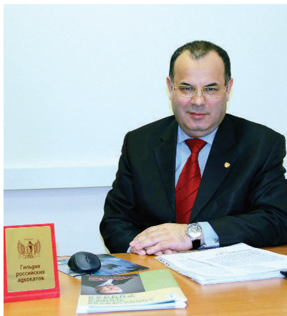
В рабочем кабинете

Однако времена тогда были не самые сладкие. Семья наша – отец, мать и пятеро детей – жила очень бедно. Родители работали в совхозе, их зар-