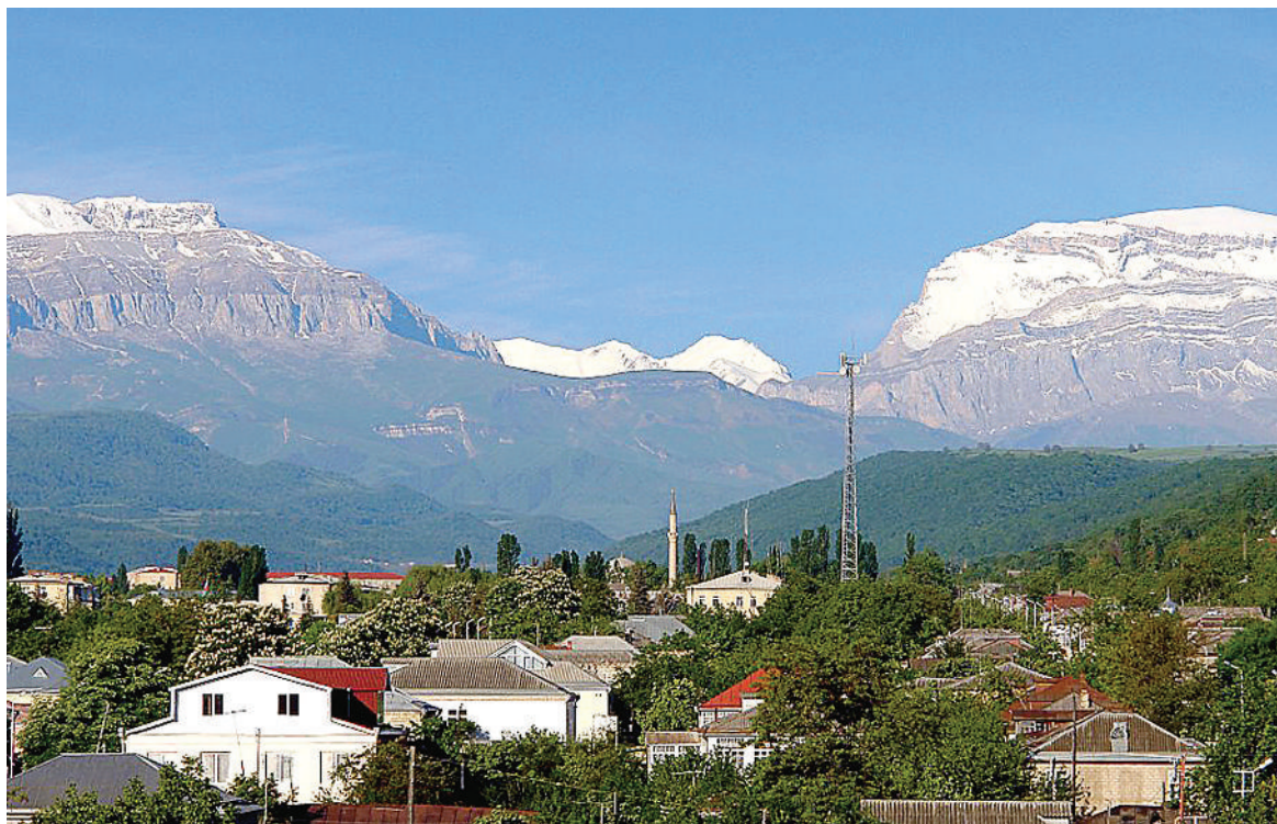
Моя малая родина

В 1991 году я завершил свое обучение на вечернем отделении юридического факультета с несколькими