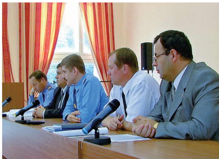
На оперативном совещании в УВД ЮАО, 2007 г.

А.М.: Естественно, я использую накопленный опыт следственной работы. Я знаю, чем дышит следствие, понимаю логику решений следователей. Вообще, считаю, что адвокат, который занимается уголовными делами, должен обязательно проходить хотя бы трех-четырехгодичную практику именно следственной работы. Адвокатам необходимо знать тонкости следственной работы: как возбуждаются уголовные дела, как расследуются, чтобы осуществлять более профессиональную защиту прав и интересов своего доверителя.