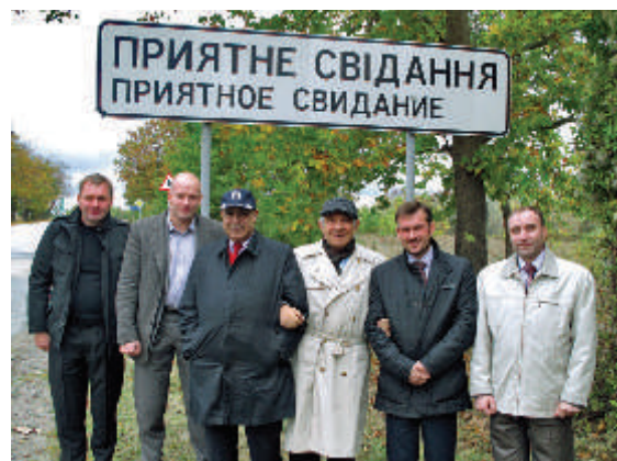
Между Симферополем и Севастополем. По преданию на этом месте встретились Екатерина II и граф Потемкин