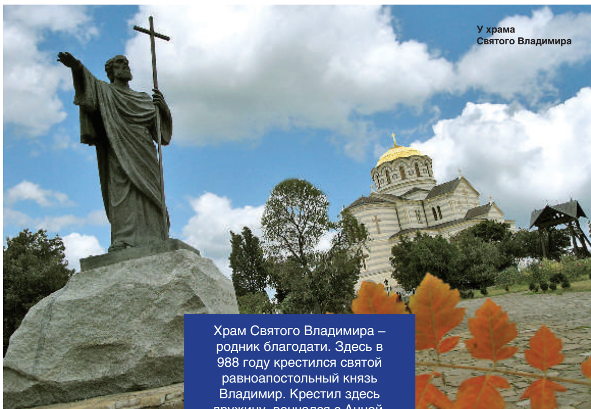
У храма Святого Владимира

Храм Святого Владимира – родник благодати. Здесь в 988 году крестился святой равноапостольный князь Владимир. Крестил здесь дружину, венчался с Анной, вернулся в Киев и крестил Киевскую Русь. Здесь сердце земли русской.