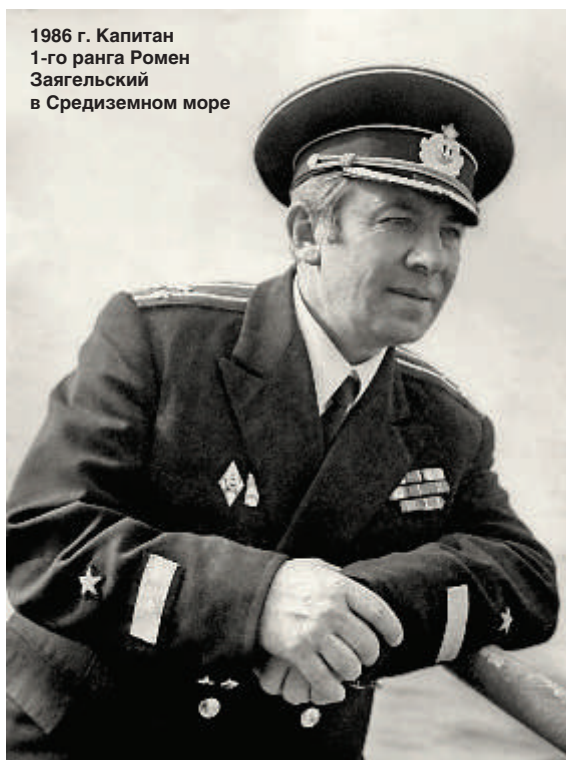
1986 г. Капитан 1-го ранга Ромен Звягельский в Средиземном море