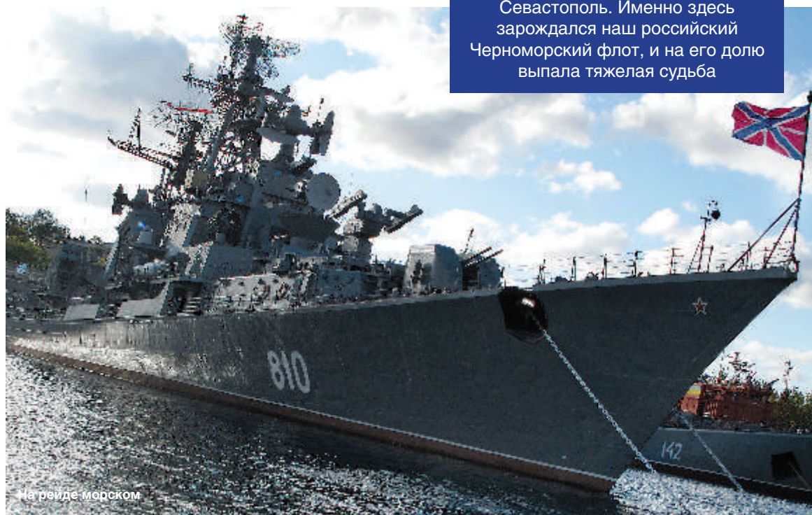
На рейде морском

1783 год. По Указу императрицы Екатерины II заложен крупнейший на Черном море незамерзающий морской и рыбный порт – Севастополь. Именно здесь зарождался наш российский Черноморский флот, и на его долю выпала тяжелая судьба