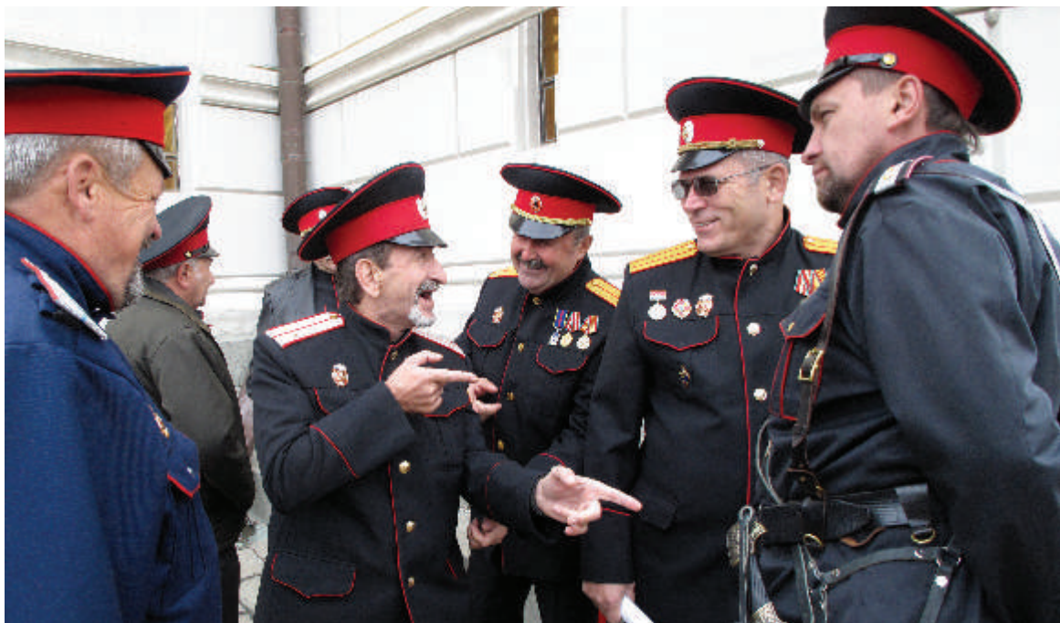
Гутарят меж собой казаки