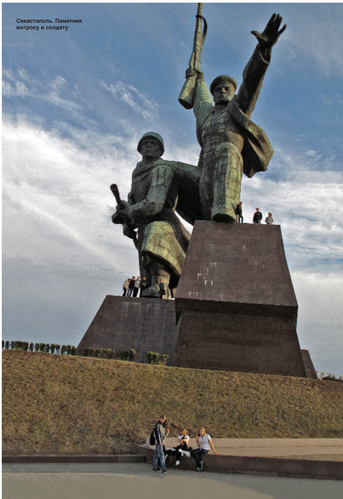
Севастополь. Памятник матросу и солдату