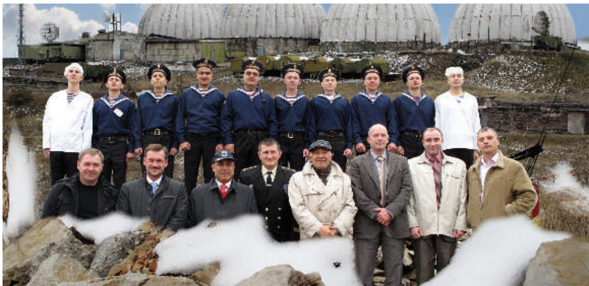
Гора Ай-Петри, фото на память