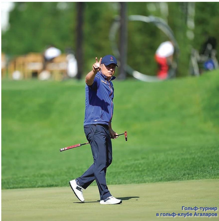
Гольф-турнир в гольф-клубе Агаларов

ABP.: А какими, на ваш взгляд, личностны-