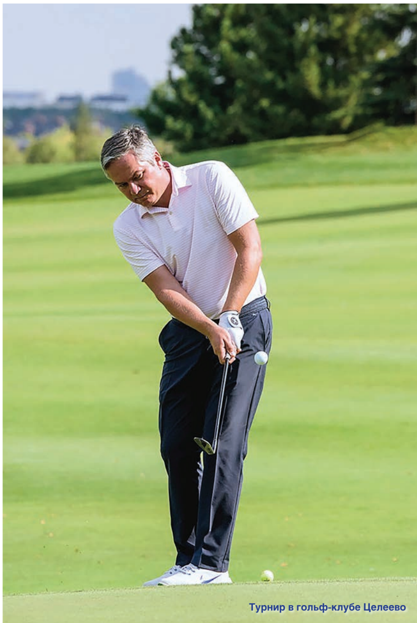
Турнир в гольф-клубе Целеево

ми и профессиональными качествами должен обладать адвокат, чтобы стать успешным?