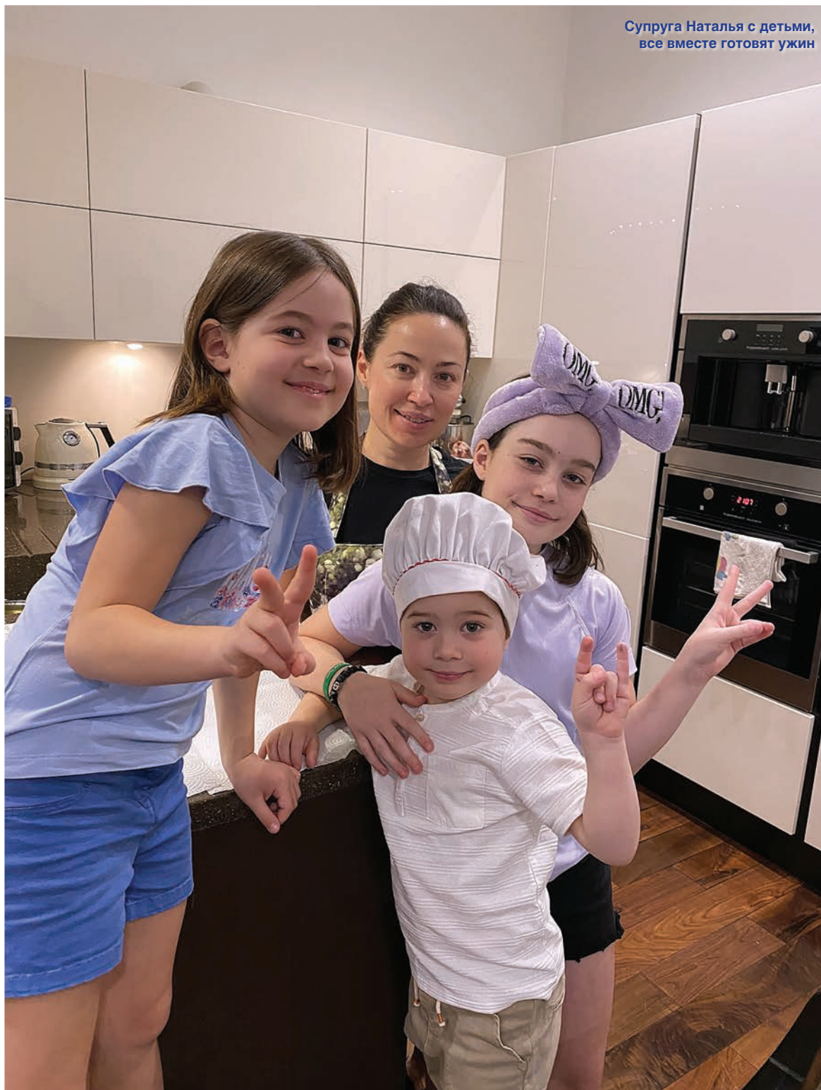
Супруга Наталья с детьми, все вместе готовят ужин