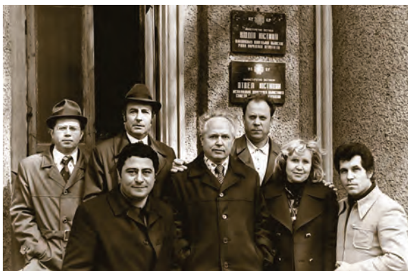
С коллегами из прокуратуры. 1980

За это время я разработала ряд важных мер, касающихся экономических и налоговых преступлений. Следует помнить о том, что очень важно не упустить время, так как в соответствии с НК РФ жалоба в вышестоящий налоговый орган подается в течение трех месяцев со дня, когда налогоплательщик узнал или должен был узнать о нарушении своих прав.