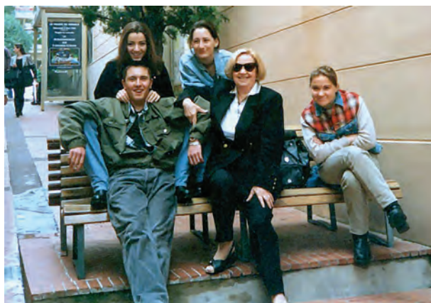
Со студентами в Париже. 1985

Вот когда у меня, адвоката с сорокалетним стажем, спрашивают, какими качествами дол-