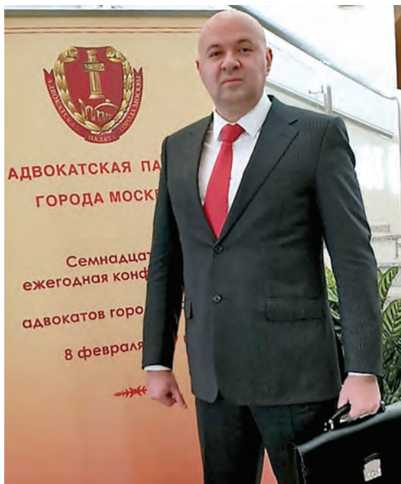
На ежегодной конференции Адвокатской палаты г. Москвы

возбужденными по факту мошенничества в городе Волгограде и в городе Новосибирске. В результате грамотной адвокатской работы в отношении моего доверителя следователем Главного следственного управления ГУ МВД РФ по Волгоградской области были вынесены постановления о прекращении уголовного преследования в связи с непричастностью к совершению двух эпизодов преступлений, предусмотренных частью 4 статьи 159 УК РФ (мошенничество в особо крупном размере), мой подзащитный был освобожден из Следственного изолятора города Волгограда прямо под новый год 31 декабря. Праздник встречал со своей семьей. В городе Новосибирске прекратил многоэпизодное уголовное дело, возбужденное по факту мошенничества в отношении моего подзащитного. Мой доверитель находился в федеральном розыске, о котором в дальнейшем он узнал случайно. По данному уголовному делу ни разу не был допрошен следователем. В результате я вылетел в город Новосибирск для осуществления его защиты. Благодаря грамотной адвокатской работе было вынесено следователем постановление о прекращении уголовного преследования в отношении моего подзащитного.