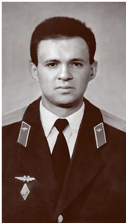
Курсант Харьковского высшего военного авиационного инженерного Краснознаменного училища