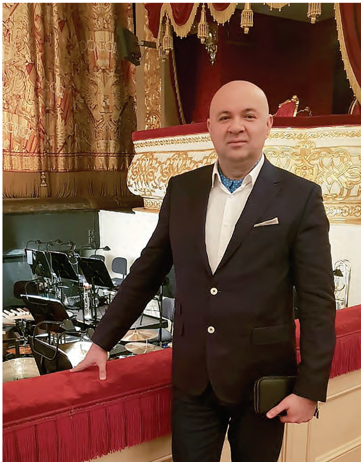
Театр – это всегда праздник!