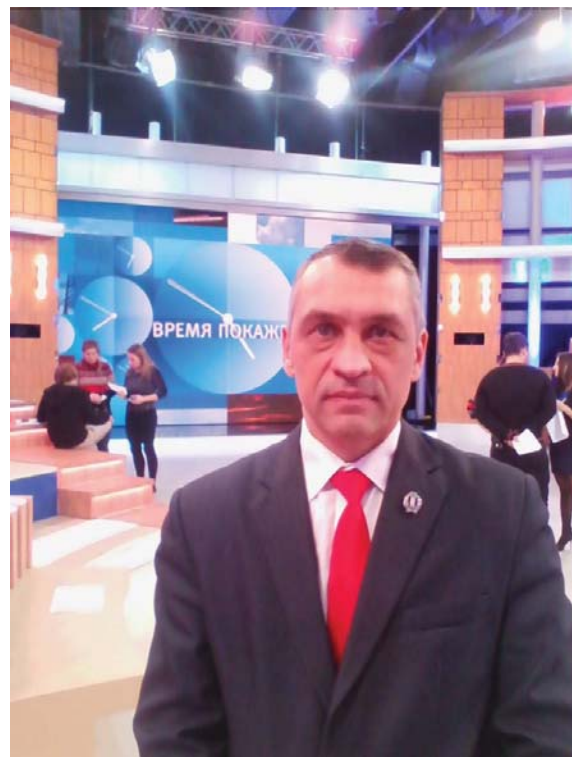
Юрий Витальевич часто выступает экспертом на ТВ

рода Москвы. С 2014-го по 2015 год был членом политической партии «ЛДПР». Принимал участие в выборах от этой партии, но... Все, как всегда – опять второе место. На первом – представители партии «Единая Россия».