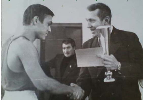
Лучший боксер Поволжья, Новокуйбышевск, 1981

самовыдвиженцем, и занял второе место (набрал более 19%). Но из-за этих выборов лишился работы, так как мэр А.П. Нефедов и губернатор Самарской области К.А. Титов распорядились, чтобы меня нигде не брали на работу. И знаете эти испытания помогли мне закалиться, стать сильным. Так что спасибо экс-мэру Нефедову и экс-губернатору Титову – только благодаря