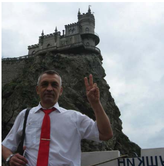
В командировке по защите бизнеса и прав граждан. В Республике Крым, г. Ялта, 2015

Победил я и в отстаивании и защите нарушенных прав в ЕСПЧ. 1 октября 2019 года ЕСПЧ было вынесено решение по делу № 32737/16 «Акопджанян против России». Это дело касалось выдворения иностранного гражданина с территории РФ. Заявитель был осужден за преступление, и согласно при-