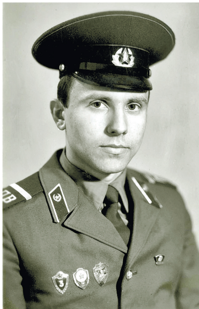
Служба в армии, КПП «Мезень». Архангельская область. 1984

В.Ч.: Думаю, что главный человек, которому я обязан всем своим существованием в адвокатуре, – это