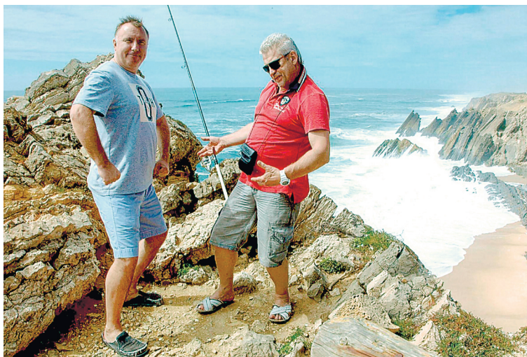
Рыбалка в Португалии. 2014