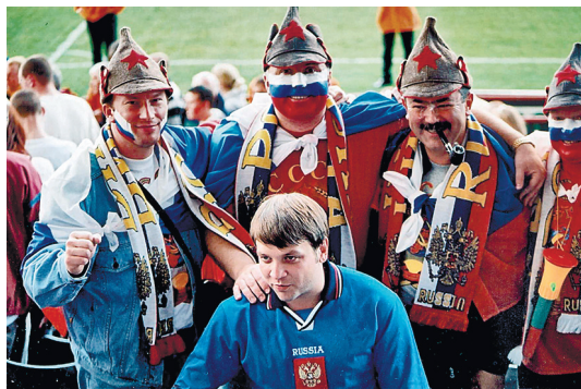
Болельщики, выезд с доверителями. Швейцария. 2003