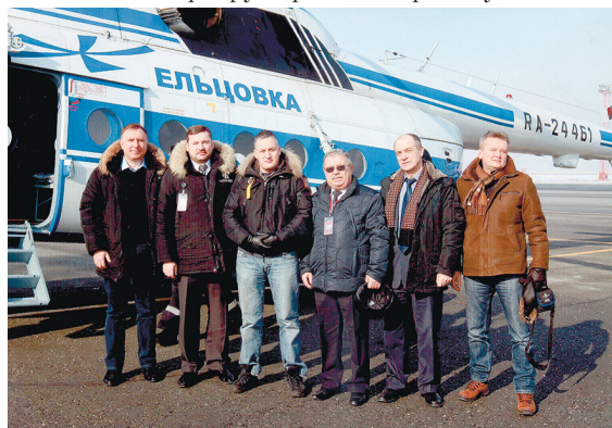
С руководителями Росавиации. Аэропорт Толмачево, Новосибирск. 2012

Вот было у меня одно дело в начале 2000-х годов. Семья, муж работает в ЖЭКе плотником, жена и трое несовершеннолетних детей, живут в маленькой комнате в большой квартире и стоят на очереди на жилье уже 20 лет. Эта очередь все не подходит и не подходит. Префектура предлагает им заключить договор аренды коммерческого найма на три года отдельной трехкомнатной квартиры с условием освобождения комнаты, которую они занимают. Муж подписывает договор, они выселяются из своей комнаты и переезжают в предложенную квартиру. Живут три года. Когда срок закончился, им велят освободить квартиру. При этом предыдущее место