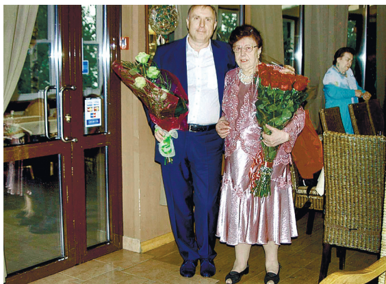
С мамой на моем юбилее. 2014