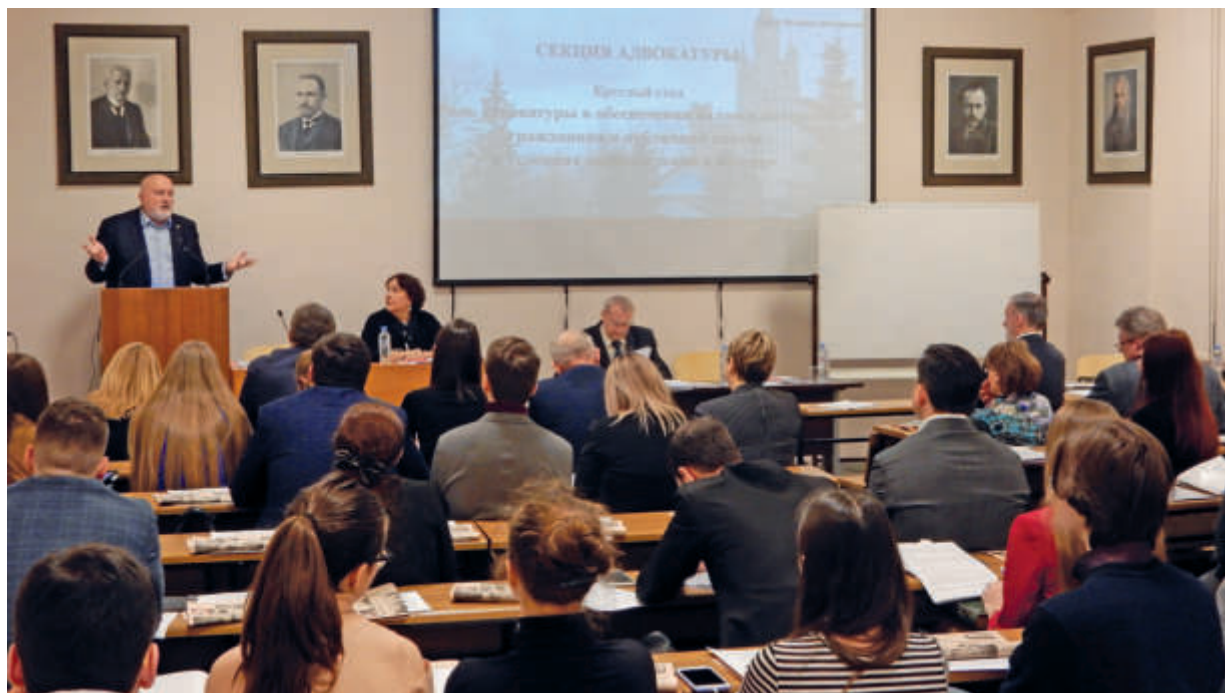
На круглом столе кафедры о роли адвокатуры

петентностный подход в преподавании юридических дисциплин является обязательным.