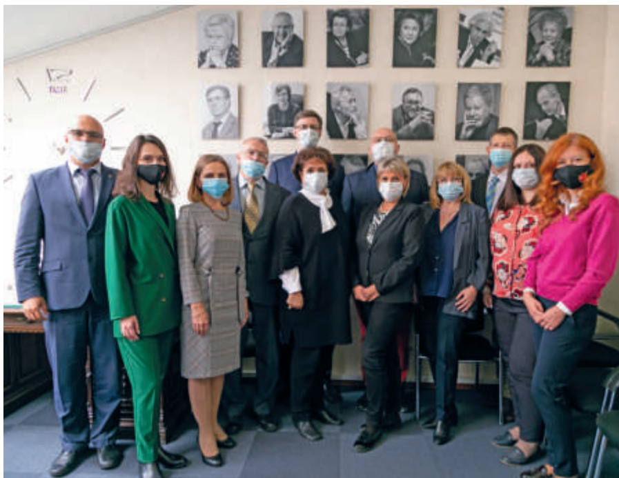
Кафедра в условиях пандемии

Адвокатуры вместе с моими коллегами, практикующими адвокатами.