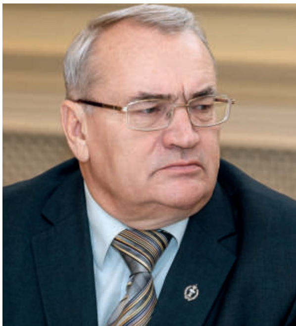
АЛЕКСЕЙ ГАЛОГАНОВ, вице-президент ФПА РФ, президент ФСАР, президент АП Московской области, доктор юридических наук

29 июня 2020 г. первая общественная организация российской адвокатуры — Федеральный союз адвокатов России — отметила свой 30-летний юбилей