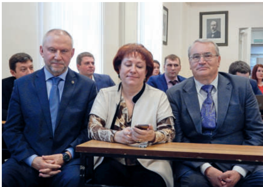
Три вице-президента на конференции кафедры

Разумеется, это более высокий уровень знаний, более ответственное поручение, поскольку слушателями и участниками курсов повышения квалификации, вниманию которых мы представляем материалы наших лекций, тренингов