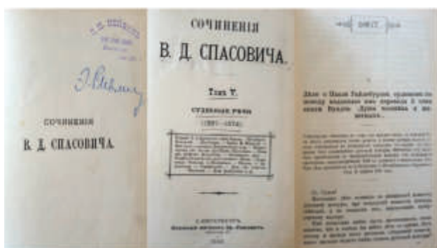
«СОЧИНЕНИЯ В.Д. Спасовича. Томъ V. Судебныя рѣчи». 1867–1874 гг. СПБ, 1893 г.

Многочисленные речи «короля адвокатуры», в которых он отстаивал честь, справедливость, человеческое достоинство, до сих пор служат поучительным учебником для современных российских адвокатов.