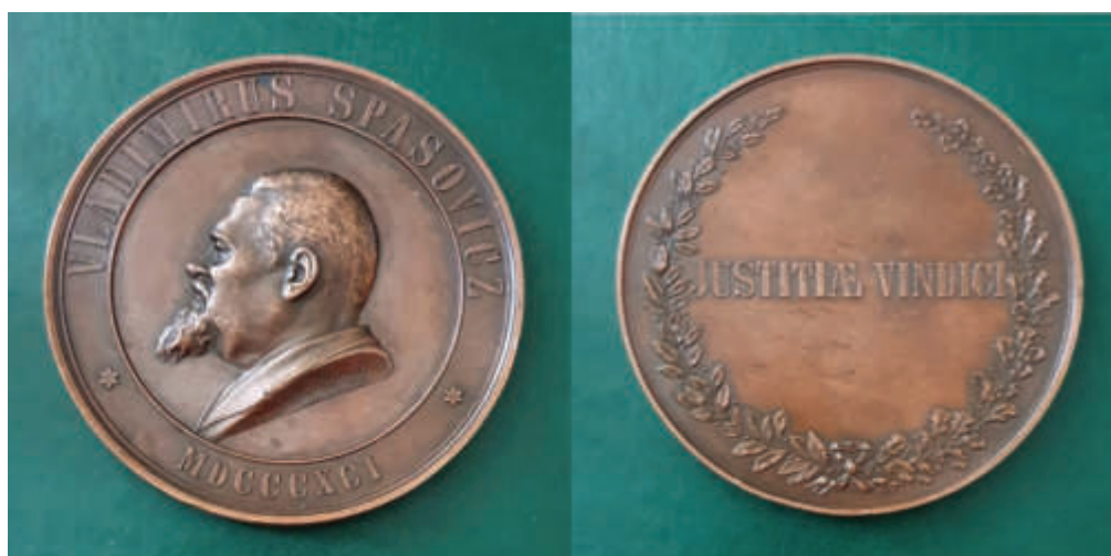
Настольная медаль «В память 25-летия службы присяжного поверенного В.Д. Спасовича. 1891 г.» Л.ст.: «Подпись медальера А.Х. Штейнман (на обрете в две строки: «f. Welonski (по эскизу П.А. Велонского), Steinvan (А.Х. Штейнман)». На обороте фраза «Justitia(e) Vindici» (лат.) — «Справедливость отстаивающий» Бронза, 277,59 гр. Из собрания И.Б. Бушманова

развития российской присяжной адвокатуры. Ни до, ни после такого признания корпорации и общества не удостоивался никто из адвокатской среды.