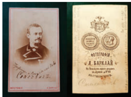
Оригинальное фото. Фотограф: Барклай Людвиг Вильгельм 1867–1870. Невский проспект, дом 29 (мастерская). Подписи чернилами: «Профессоръ и присяжный поверенный Спасовичъ.» Из собрания И.Б. Бушманова

Некоторое время назад уникальным достоянием моего собрания юридических артефактов стали два раритетных предмета: оригинальная фотография периода 1868–1870 гг. признанного коллегами короля российской адвокатуры Владимира Даниловича Спасовича (1829–1906 гг.) и бронзовая настольная медаль, выпущенная к 25-летию его адвокатской деятельности, которое помпезно отмечалось в Санкт-Петербурге в 1891 г.