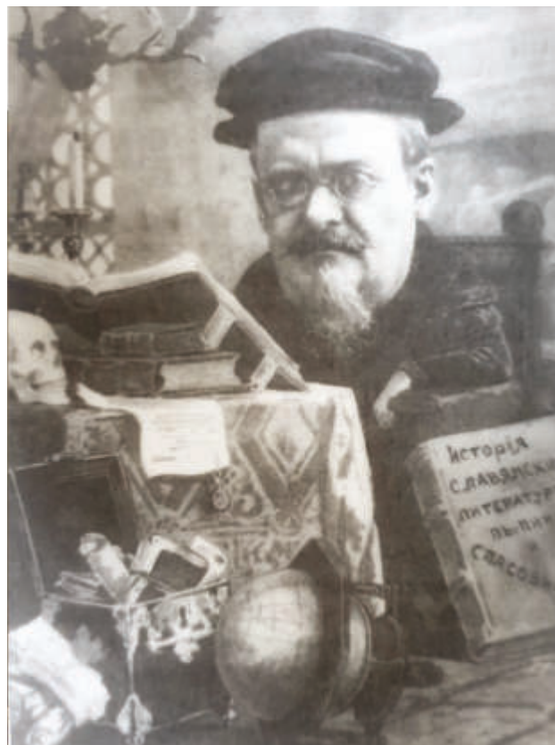
Одна из известных карикатур на В.Д. Спасовича. Из книги «Об адвокатуре — интересно». А. Савич, Е. Яковлев. СПб, 2005 г.

При этом среди действующих адвокатов именно Спасович, как особо яркая в корпорации личность, был частым героем различных карикатур.