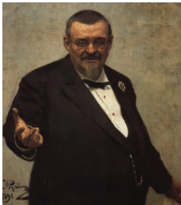
Портрет В.Д. Спасовича кисти художника И.Е. Репина. Холст, масло, 1891 г.

Портрет В.Д. Спасовича работы великого художника И.Е. Репина (написан художником в 1891 г. по заказу Петербургского Совета в ознаменование 25-летия пребывания нашего героя в звании присяжного поверенного. — Прим. автора ) украшал зал заседаний Совета присяжных поверенных СПб в здании СПб Окружного суда. Замечательный портрет по счастью не сгорел вместе со всем адвокатским и судейским имуществом в лихие дни февральской Революции 1917 г. и в полной сохранности в настоящее время находится в экспозиции Государственного Русского музея.