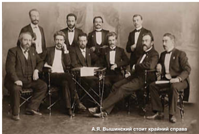
А.Я. Вышинский стоит крайний справа

графию Вышинского, то легко заметить, что его участие в Батумском процессе 1902 года тщательно завуалировано. Например, в изданной Всесоюзной книжной палатой в 1941 году под редакцией Кузятиной биографии Вышинского написано: «С 1902 года – участник революционного движения на юге России и на Кавказе». Поди догадайся, о чем речь!» 5 . О чем, о чем, а о завуалированности деятельности помощника присяжного поверенного Вышинского спорить трудно.