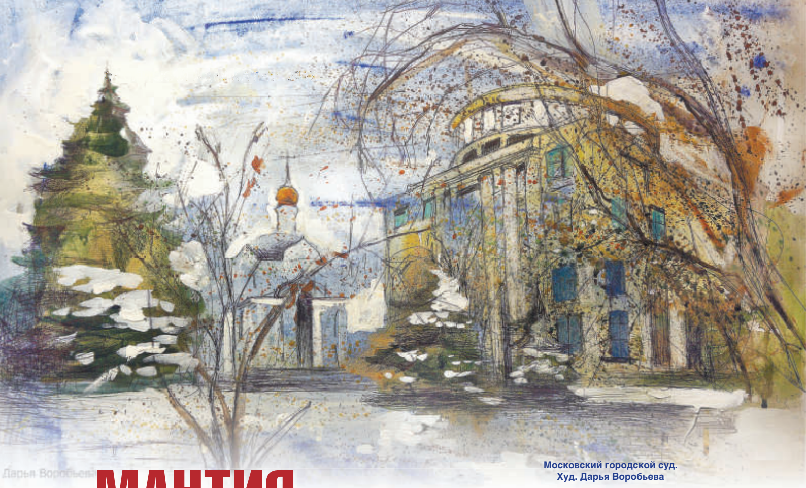
Московский городской суд. Худ. Дарья Воробьева