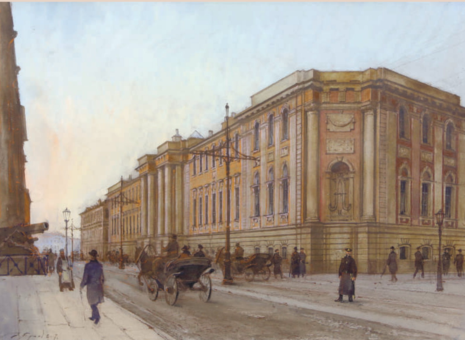
Картина из цикла «Юридический Петербург». Здание Министерства юстиции Российской империи. Ул. Итальянская, д. 25. Тонированная бумага, смешанная техника (акварель, гуашь, пастель). Заслуженный художник России Андрей Трость.

Читайте очерк «На развалинах старого суда», стр. 30–31