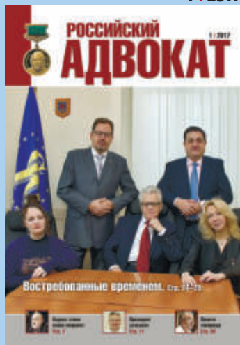
Наша обложка: Межреспубликанская коллегия адвокатов