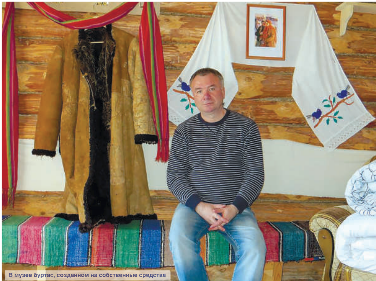
В музее буртас, созданном на собственные средства

Беседа построена на основе публикаций в социальной сети Facebook, газетах «Коммерсантъ», «Московский комсомолец», электронных и сетевых СМИ