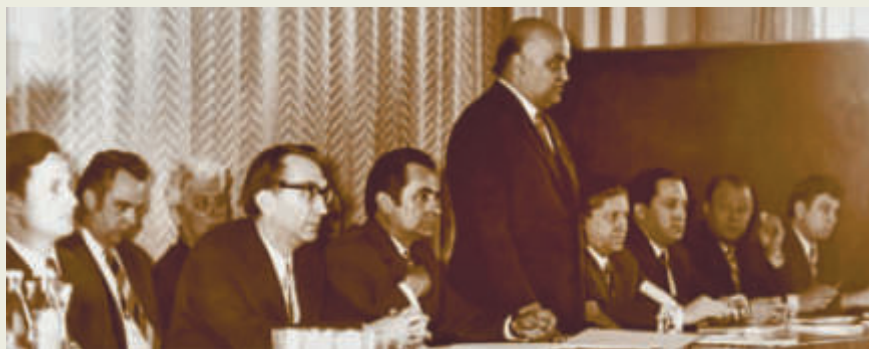
1979 год. Одно из совещаний в Минюсте СССР в преддверии перемен в специальной адвокатуре. В президиуме (слева направо): В.П. Репкин, Л.В. Белоусов, В.И. Теребилов, Н.А. Осетров и В.Т. Губарев

27 июня 1947 г. Указом Президиума Верховного Совета СССР определен порядок организации деятельности правоохранительных органов, судов и адвокатуры на особорежимных объектах и в закрытых территориальных образованиях.