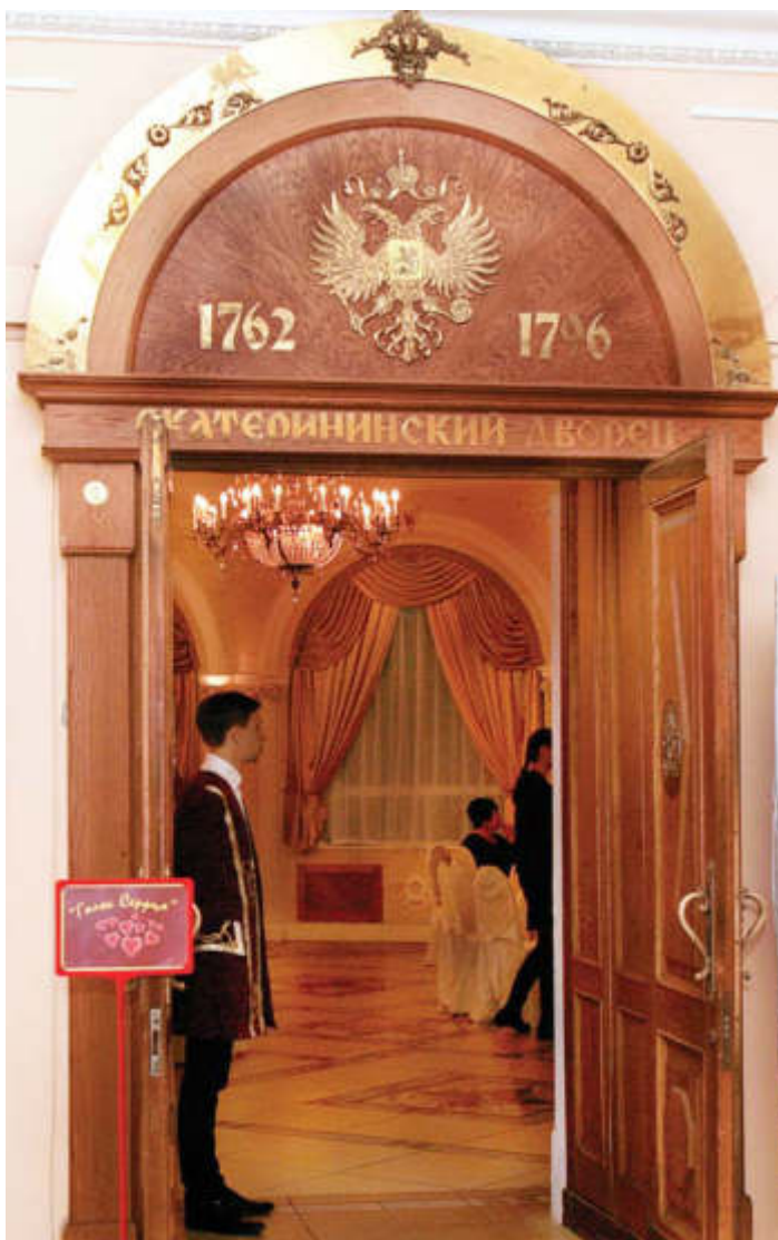
▲ Великолепие Екатерининского зала