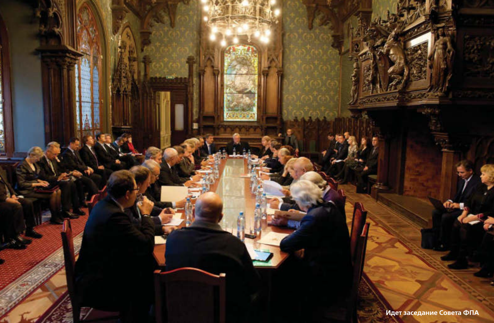
Идет заседание Совета ФПА