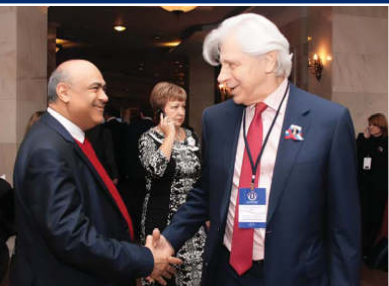
▲ Дружеское рукопожатие