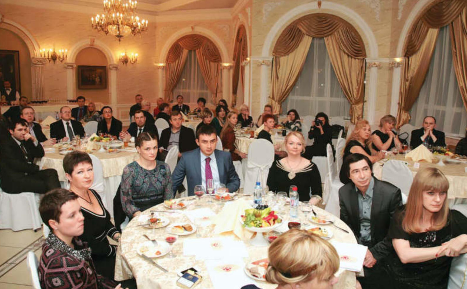
▲ Сверкал огнями Званный вечер