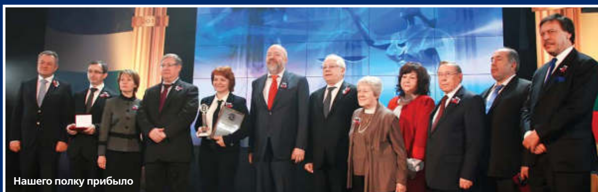
Нашего полку прибыло