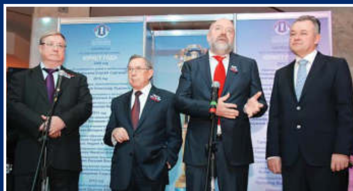
▲ Руководству АЮР есть чем гордиться!