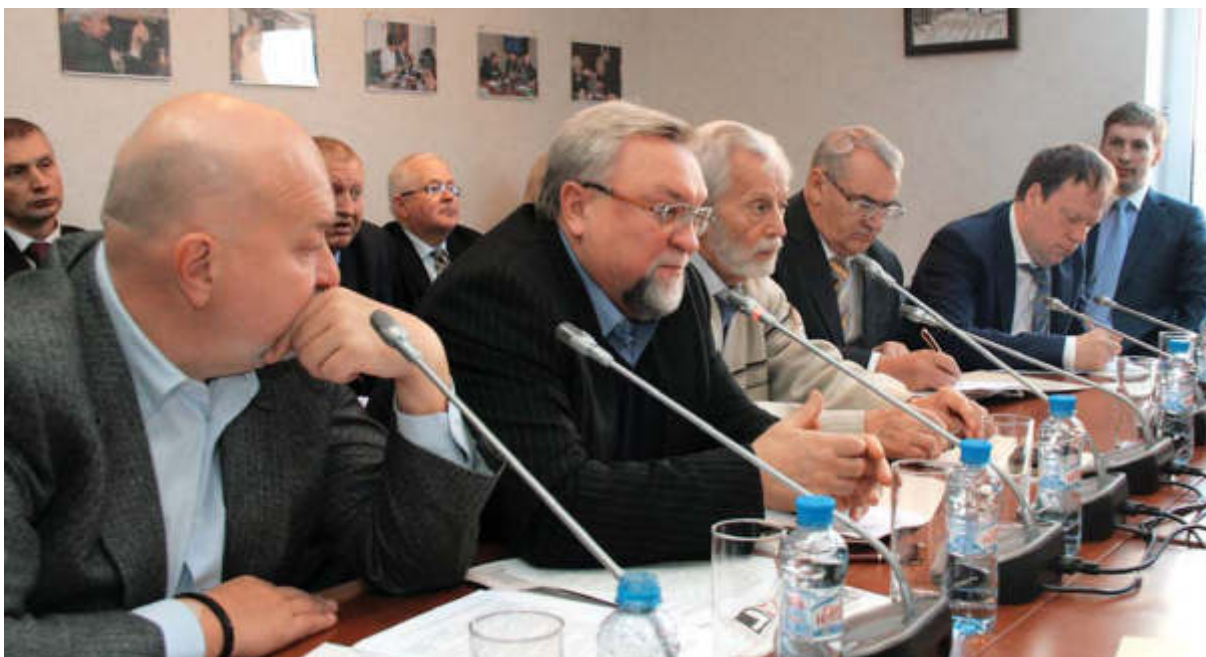
▲ В президиуме

управления в адвокатском сообществе, позволят восполнять некоторые пробелы в законодательном регулировании корпоративными решениями.