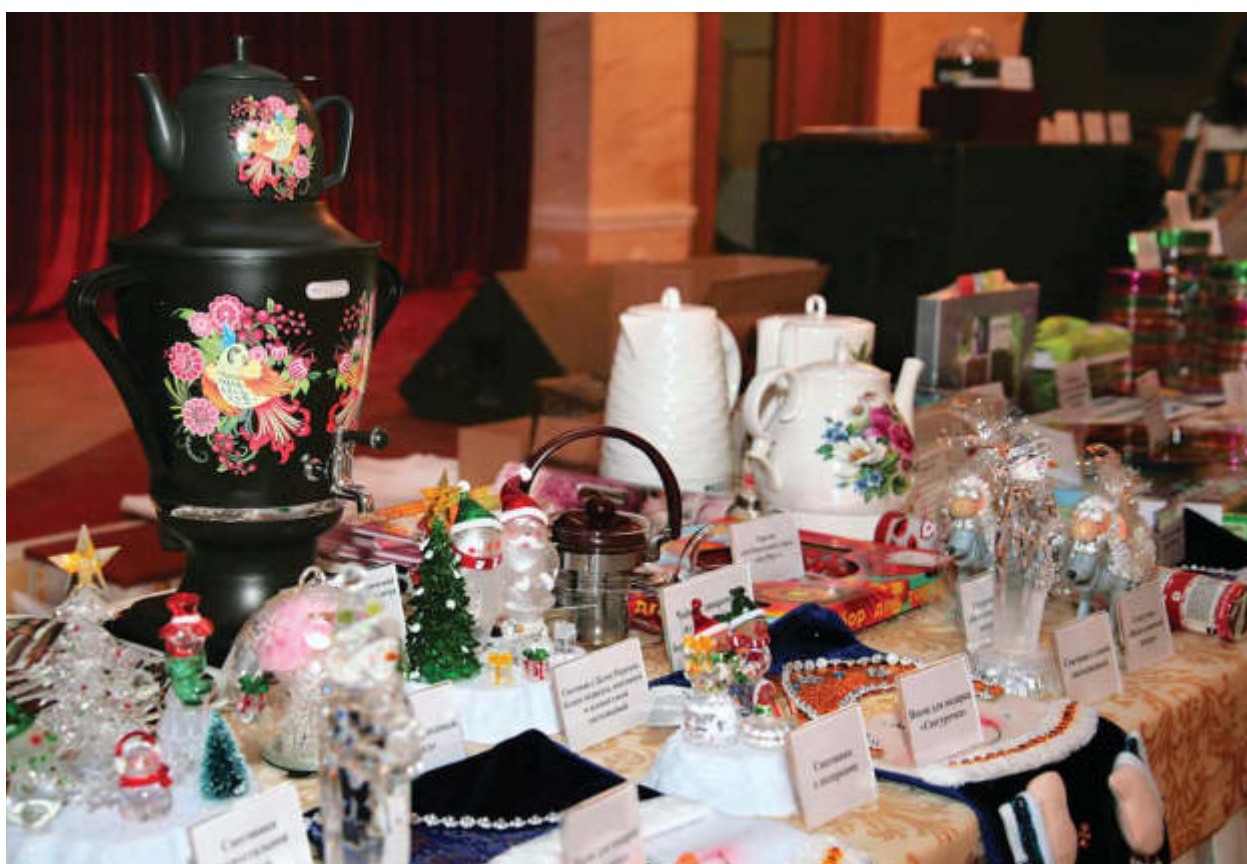
▼ Лоты аукциона