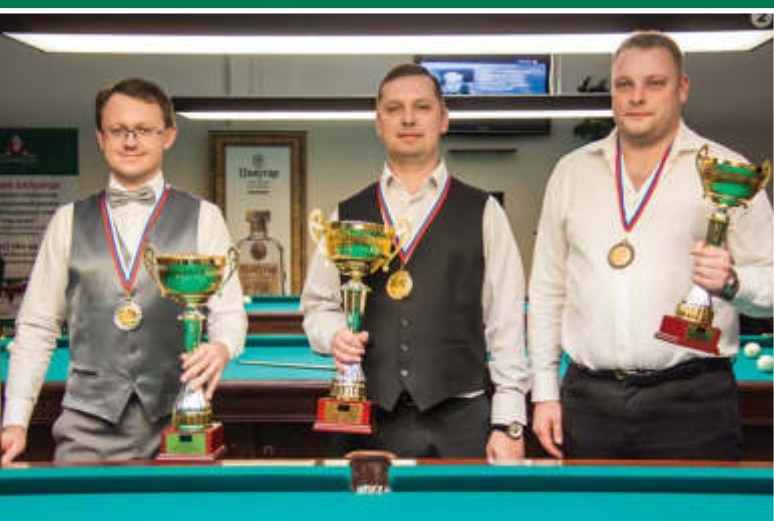
▲ Победители турнира