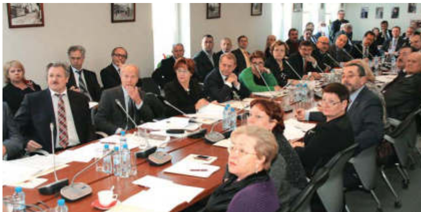
▼ На заседании Совета ФПА

Наш корр.