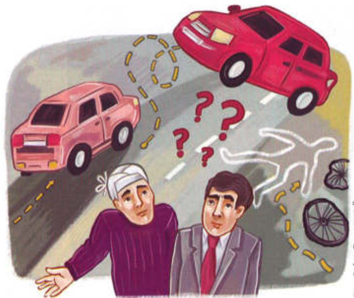
Рис. Софья Бестужевой

Адвокат Леонид ЧЕЛЯПОВ , кавалер ордена «За верность адвокатскому долгу»