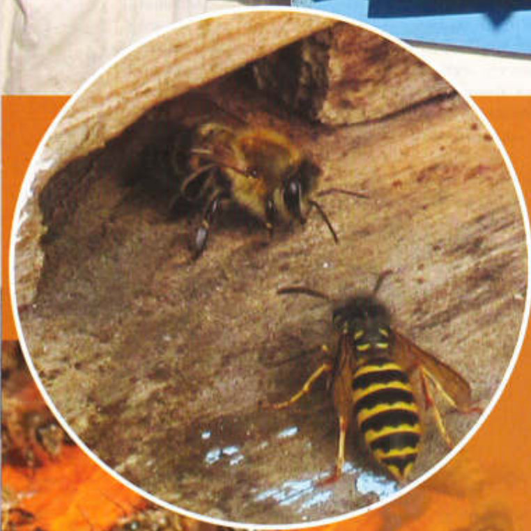
▲ Пресекая правонарушение (пчеласторож не пускает в улей осу, пытающуюся похитить мед)