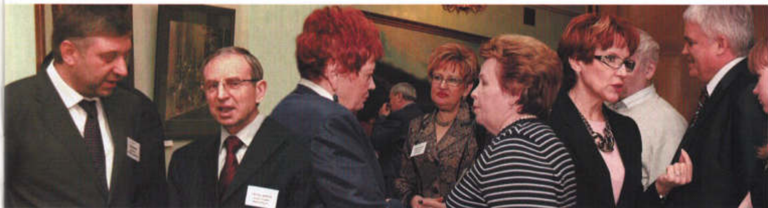
▲ Обсуждение продолжалось в кулуарах