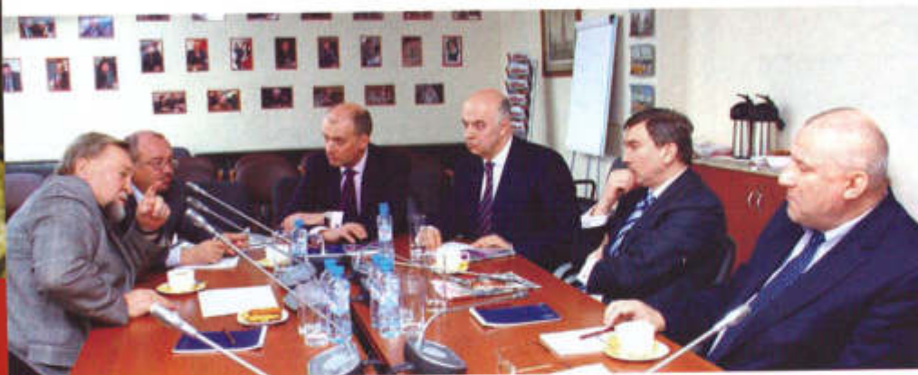
О развитии адвокатуры с чувством, с толком, с расстановкой

Участниками отмечено, что объединение адвокатов и юридических консультантов в одну корпорацию станет возможным только тогда, когда юристам будут созданы условия для развития их практики в рамках адвокатуры. Напомним, перспективу такого объединения обозначил Минюст в своем проекте государственной программы РФ «Юстиция». Особое внимание собравшиеся уделили вопросу о необходимости включения в законодательство механизмов, способных предотвратить вытеснение российской адвокатуры из ряда правовых сфер иностранными юристами. Адвокаты считают подобную перспективу возможной в связи с вступлением России в ВТО, в договоре о котором указано, что иностранные юристы могут создавать в нашей стране свои фирмы и практиковать в том числе российское право.