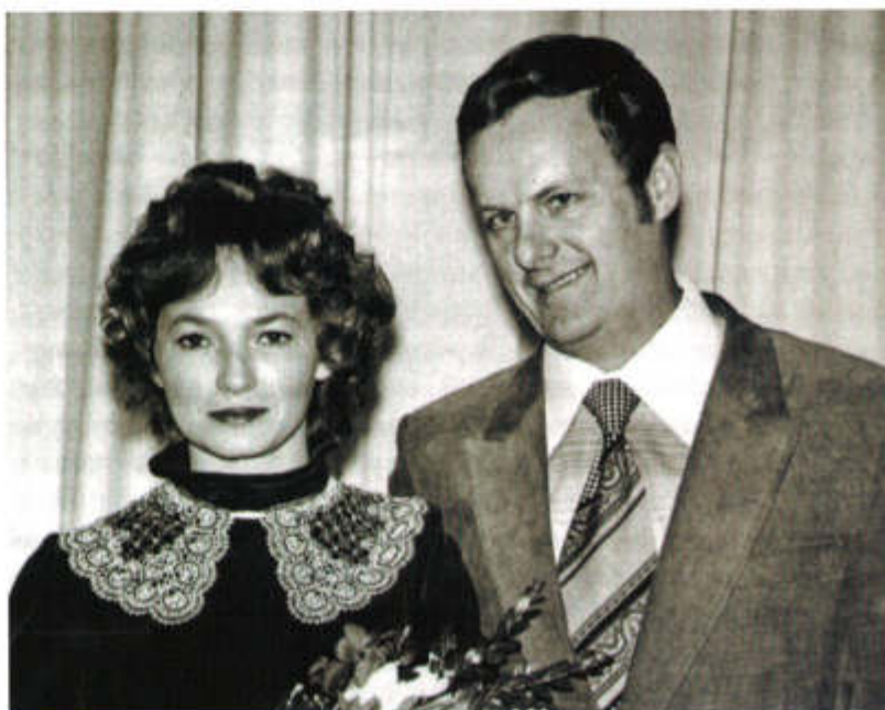
▲ Людмила Нарусова и Анатолий Собчак

Ну а будучи более 15 лет законодателем, с сожалением констатирую, что планка парламентария, которую он поднял, никем из нынешних не достигнута.