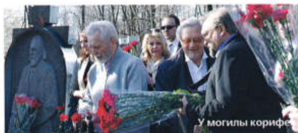
У могилы корифея