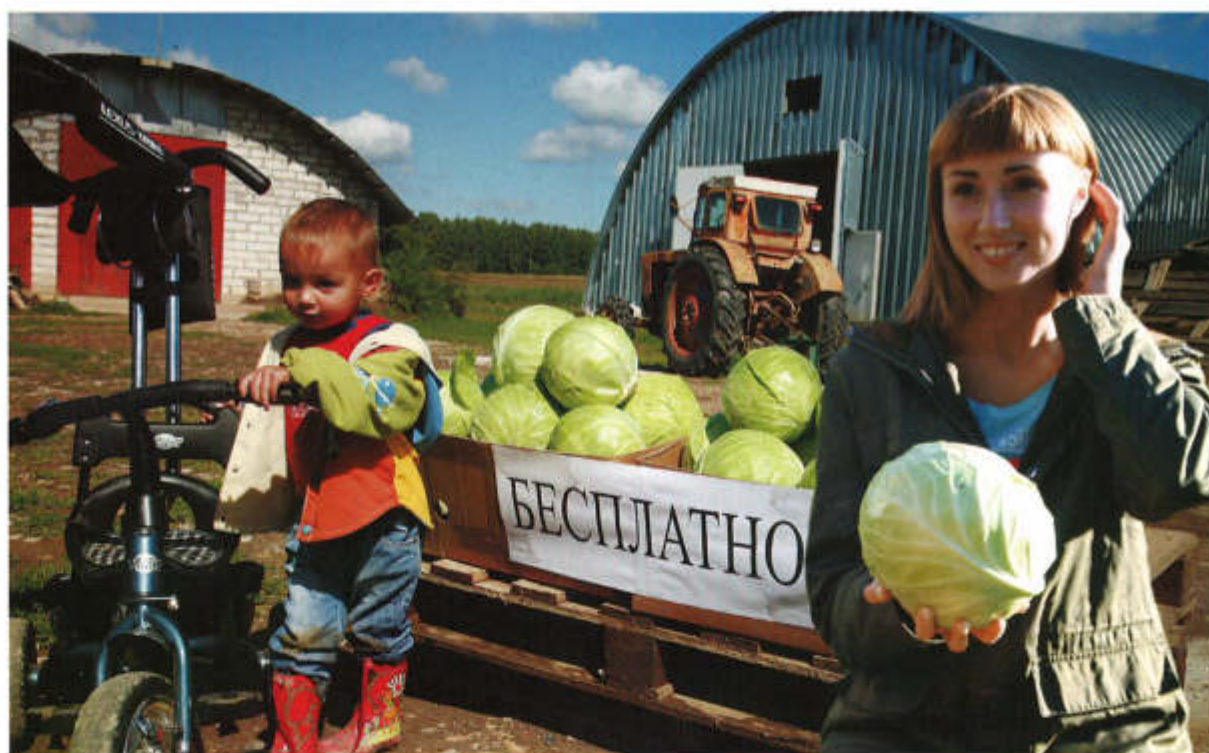
▲ На радость людям

что ни одно фермерское хозяйство не тронут. Но в районе-то их всего три. Так что нашу судьбу могут решить враз. И заставят продать земли. Якобы под строительство. Сегодня это очень выгодный бизнес. И как сложится судьба людей, положивших на эту землю жизнь, никого не волнует. А у меня душа болит. За детей, за внуков.