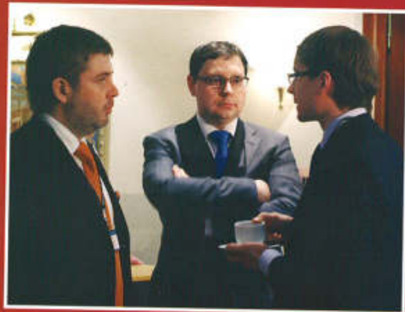
▲ Обсуждение продолжалось и в перерывах

заинтересована в этом, поскольку объединение всех юристов под крылом адвокатуры будет способствовать повышению качества предоставляемых услуг.