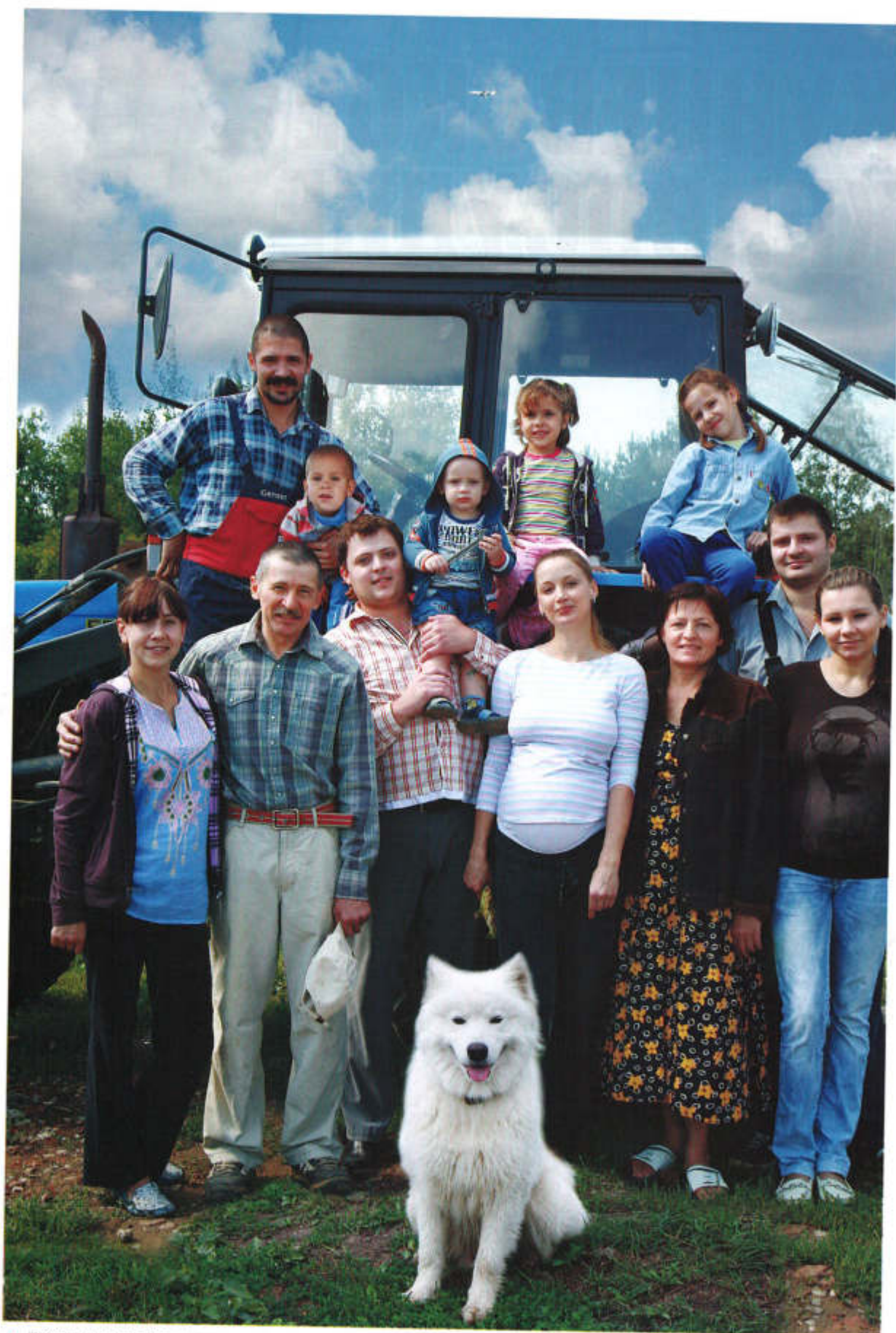
▲ Дружная семья Гончаровых