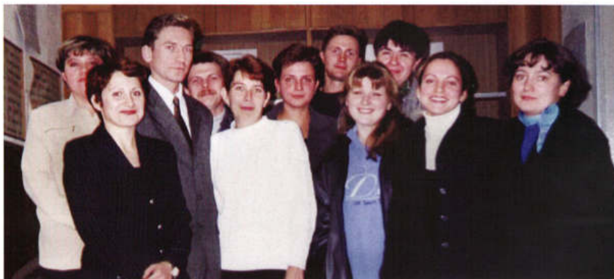
▲ С однокурсниками по Юридическому институту МВД России, 1995–1997 гг. (третий слева)

Предпринимателям гораздо выгоднее иметь дело с наделенными специальным статусом адвокатами крупной коллегии, чем содержать свою юридическую службу. И потому, мне кажется, очень важно поменять традиционный взгляд на адвокатуру, которая, безусловно, не является предпринимательством, но по сути своей представляет узкопрофессиональный, ориентированный на клиента бизнес, в котором отношения с доверителями выстраиваются на долгосрочную перспективу. В современной коллегии каждый – часть мощного структурного адвокатского объединения, способного противостоять любым нападкам со стороны. Наличие в ней базовых, постоянно действующих юридических проектов продиктовано необходимостью обеспечения работы адвокатского образования и профессионального роста ее членов. Адвокаты, участвующие в таких проектах, – наша гвардия. Благодаря их добросовестному и действенному противостоянию правоохранительным органам нас знают. Если приходится иметь дело с кем-то из наших специалистов, у противоположной стороны часто портится настроение. Кроме того, в коллегии хорошая платформа для старта молодых. И, пожалуй, наиболее важная составляющая – сильная команда менеджеров-управленцев, организационно обеспечивающая деятельность адвокатского образования, как юридического лица, и