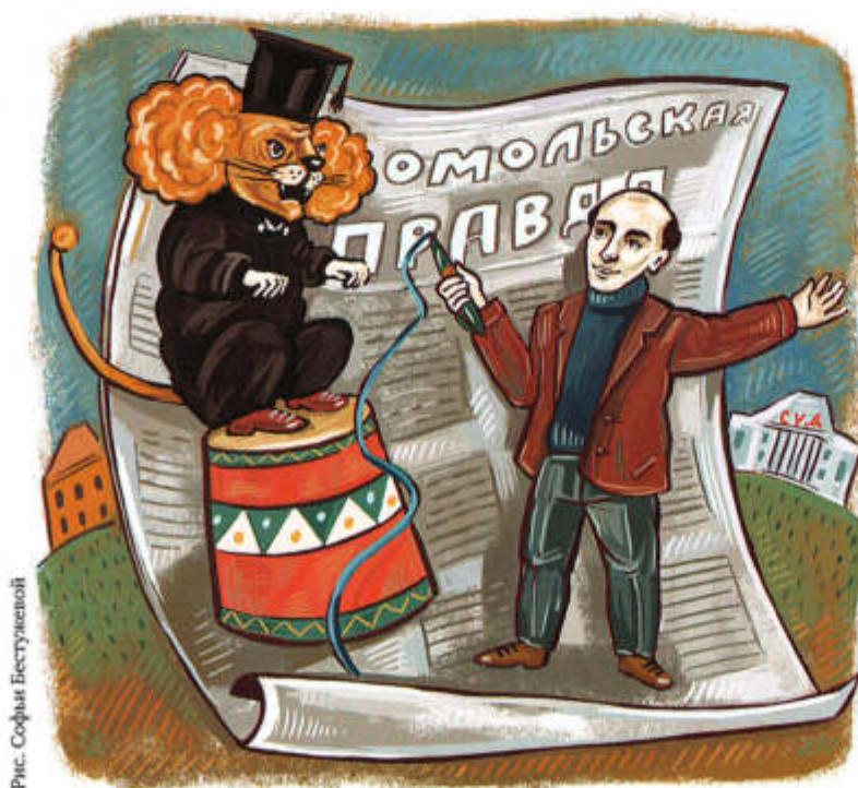
Рис. Софьи Бестужевой