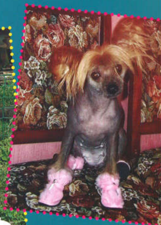
▲ Феонита или, по-домашнему, Фаня