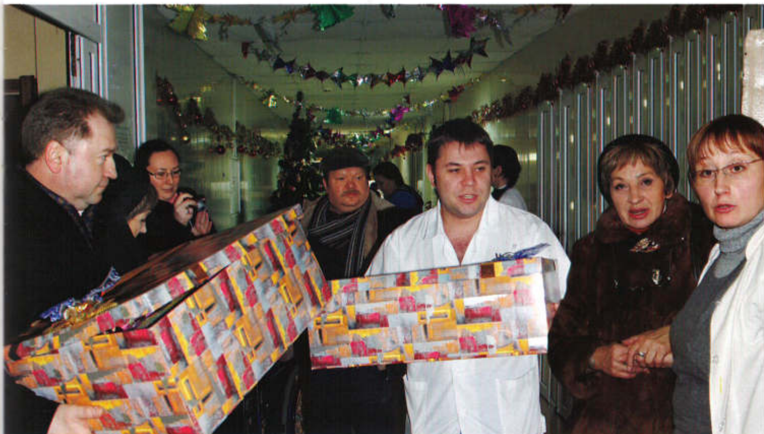
▲ Поздравление с Новым годом и передача подарков в детском отделении Московского областного онкологического диспансера

на момент заключения посредником договора действовал закон «Об авторском праве и смежных правах», а часть 4 Гражданского кодекса, на основании которого он заключался, к тому времени еще не вступила в законную силу. Это позволило нам поставить в суде вопрос о признании незаконности договора, заявить встречный иск и выиграть спор во всех инстанциях.