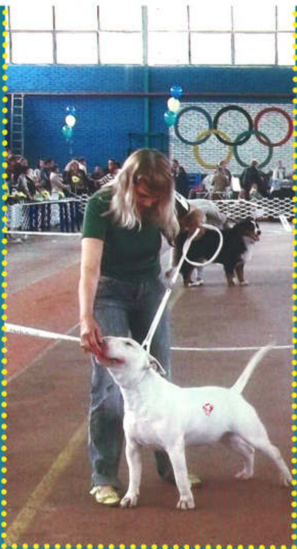
▲ Лучший юниор (на Интернациональной выставке собак всех пород CACIB – FCI «Весна Кубани – 2012»)