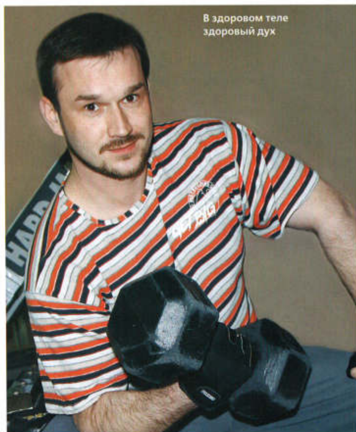
В здоровом теле здоровый дух