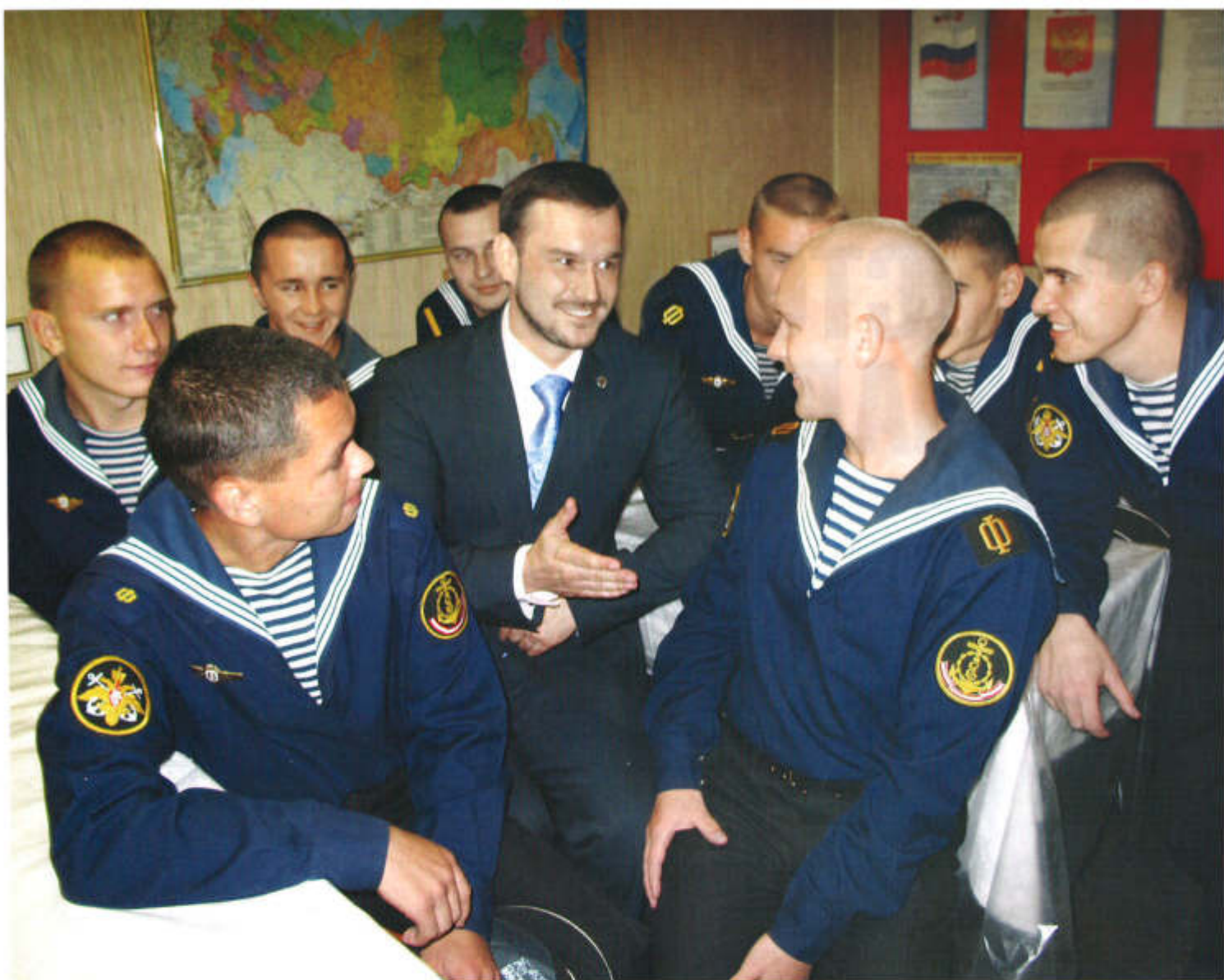
▲ Среди моряков-черноморцев ракетного корабля «Самум»