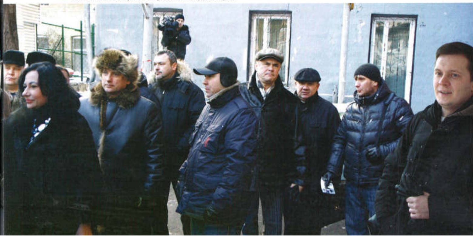
▼ Члены «Боевого братства» у здания Тверского суда