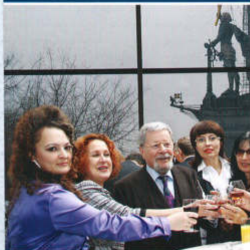
▲ За наш юбилей!

Российская Академия адвокатуры и нотариата БИБЛИОТЕКА