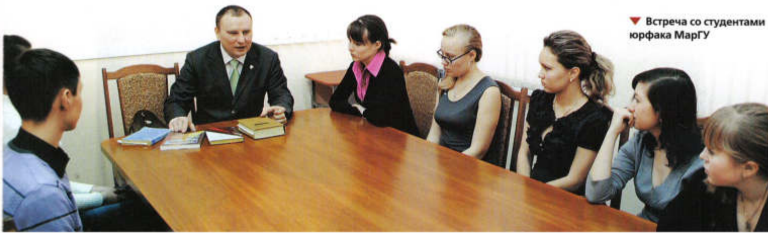
▼ Встреча со студентами юрфака МарГУ