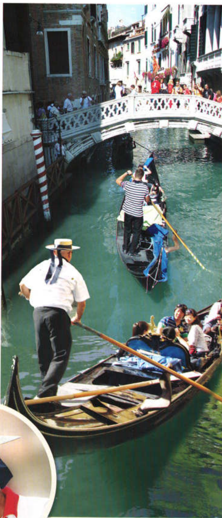
▶ Венецианские пути-дороги