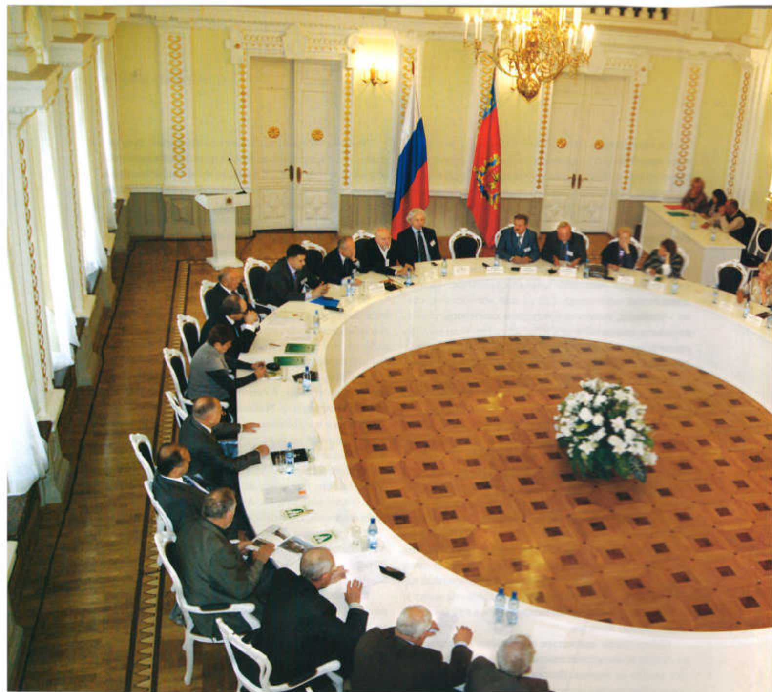
▲ Конференция президентов адвокатских палат Центрального федерального округа

ничения численности нотариусов, претендентам на эту должность приходится ждать, когда какой-нибудь член их корпорации уйдет на заслуженный отдых, а то и в мир иной. Скажу честно, не хотелось бы оказаться в таком положении. Вызывает зависть только замкнутость, но адвокатуре это «не светит».