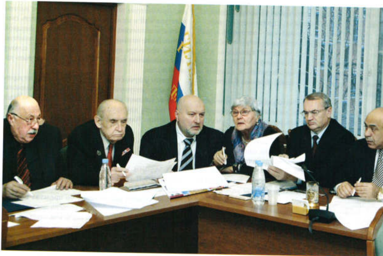
▼ На заседании комитета