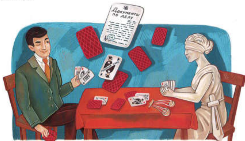
Рис. Софьи Бестужевой

Георгий ЗУБОВСКИЙ, адвокат, кандидат юридических наук, председатель президиума «Столичной коллегии адвокатов»