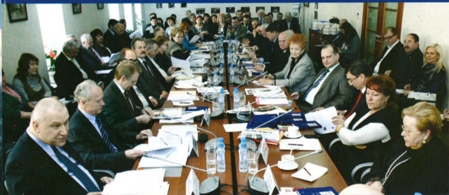
▲ Идет заседание Совета палаты