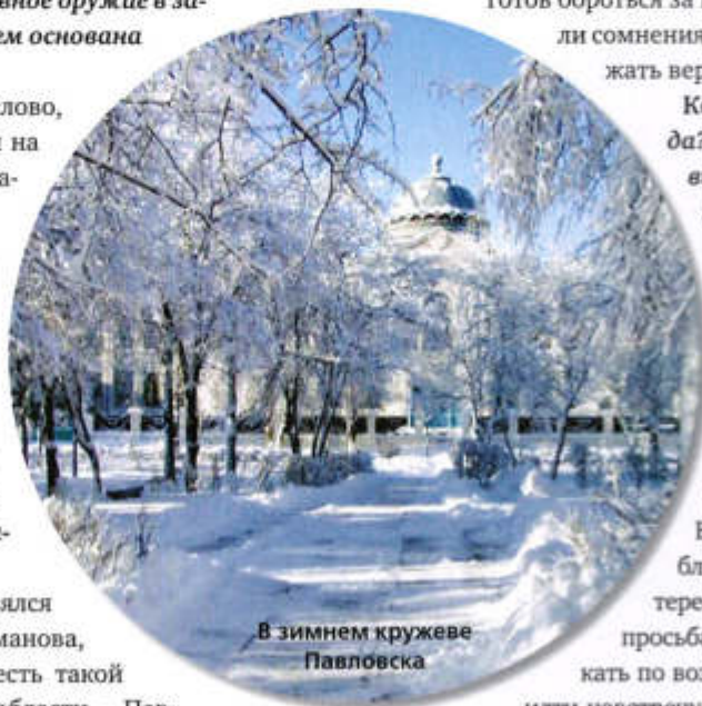
В зимнем кружеве Павловска

Светлана ЖИХАРЕВА, спецкор «Российского адвоката»