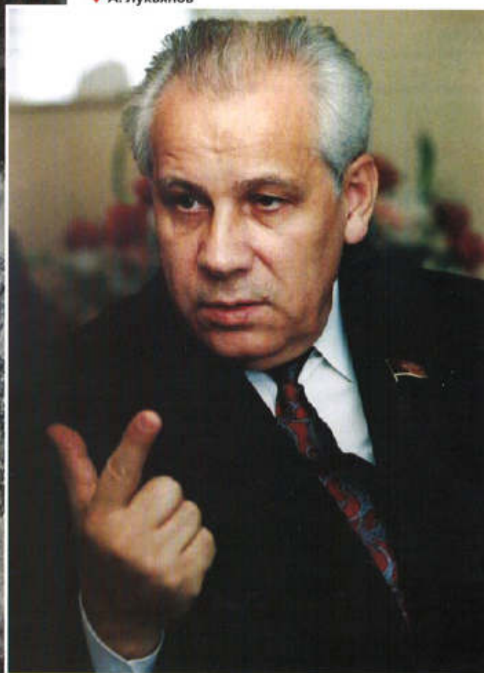
▼ А. Лукьянов

Когда Анатолий Иванович был депутатом Государственной думы третьего созыва и являлся председателем Комитета по законодательству и конституционному