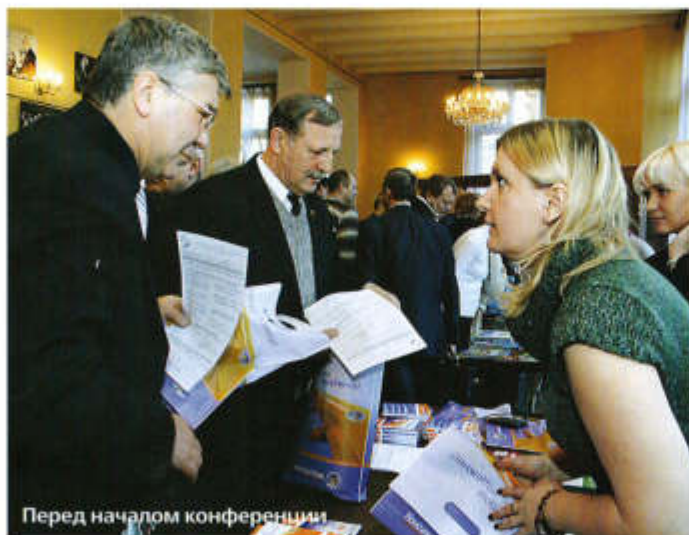
Перед началом конференции

По итогам конференции делегаты утвердили смету расходов на будущий год, избрали членов ревизионной и квалификационной комиссий, обсудили свои планы в связи с грядущими юбилейными датами – 170-летием со дня рождения Ф.Н. Плевако, 90-летием со дня образования Московской областной коллегии адвокатов, а также 10-летием Закона «Об адвокатской деятельности и адвокатуре в РФ». Адвокатским образованиям, которые добились заметных успехов, были вручены награды и ценные подарки.