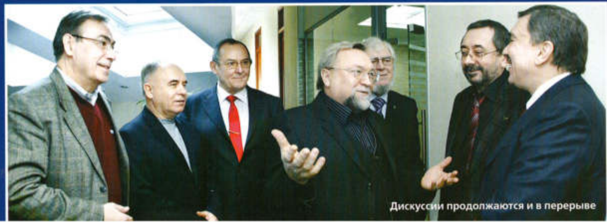
Дискуссии продолжают и в перерыве