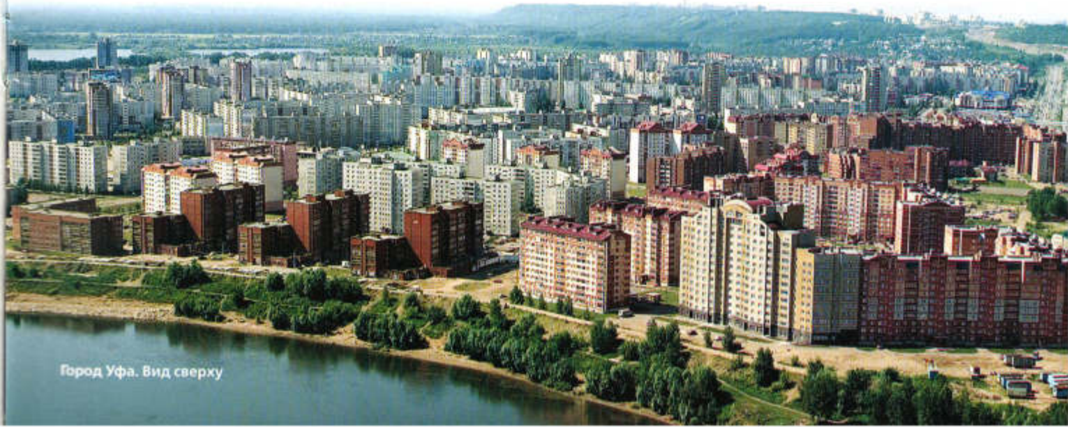
Город Уфа. Вид сверху

Валерий АББАСОВ, председатель президиума Гильдии российских адвокатов по РБ