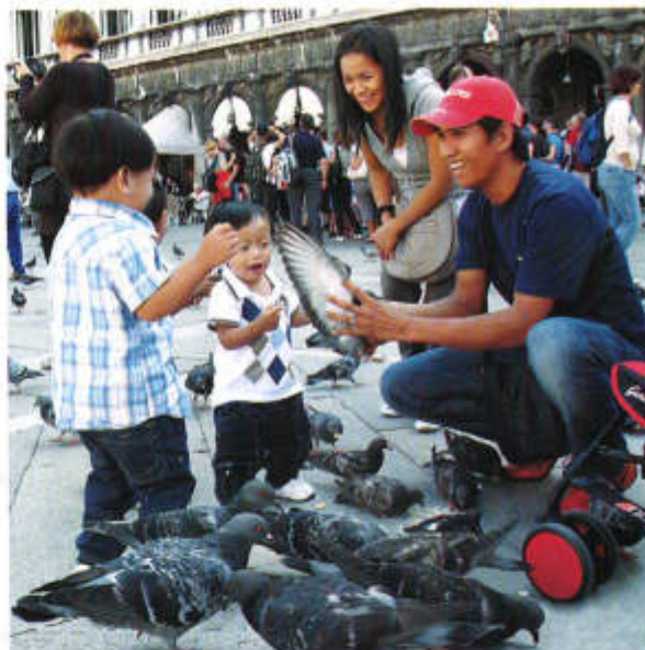
▲ На площади Сан-Марко

Визитной карточкой города является площадь Сан-Марко, где расположены дворец Дожей и собор, давший название площади. Величественный собор Сан-Марко был возведен в XI веке, в нем хранится настоящий ше-