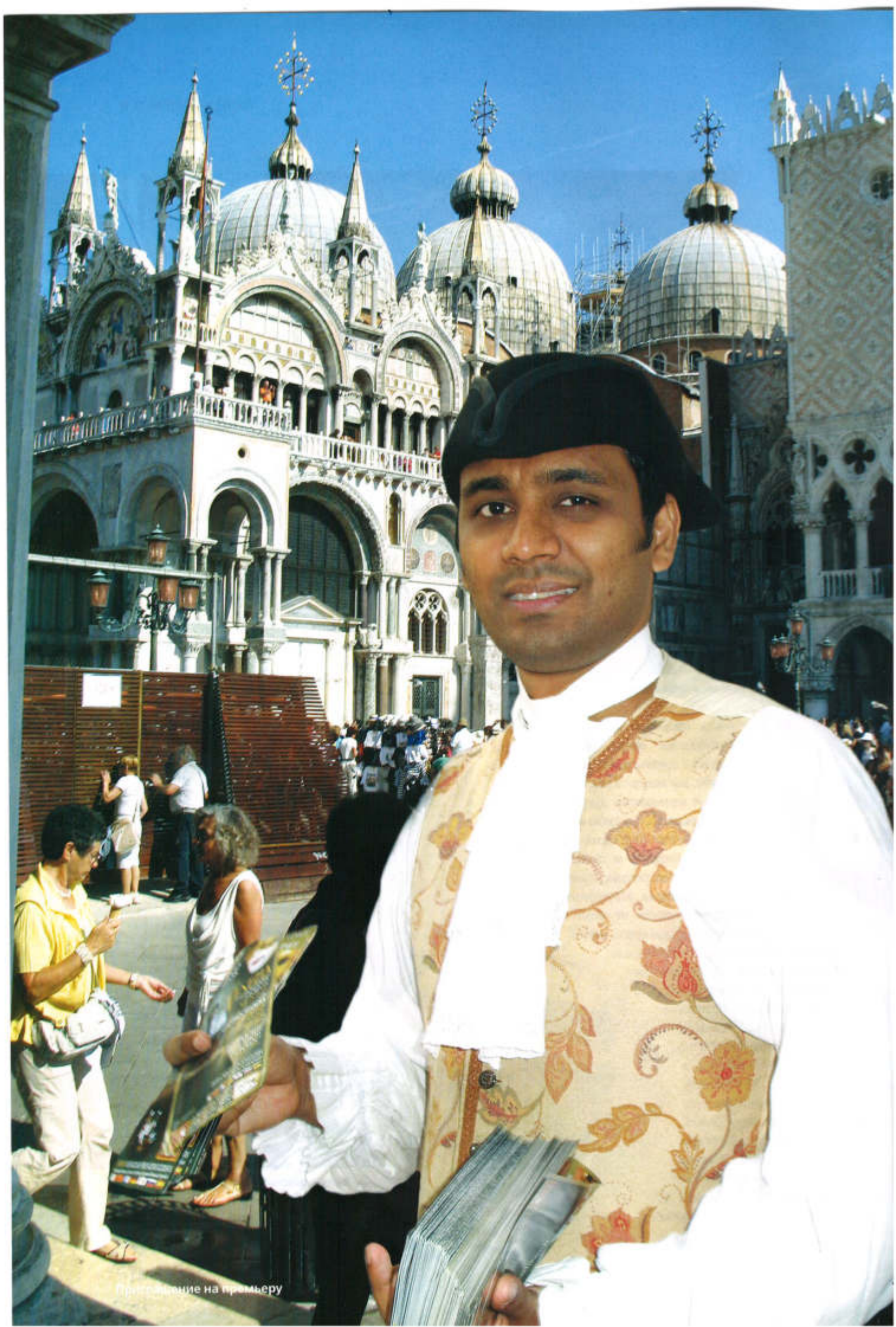
премијере на премијеру