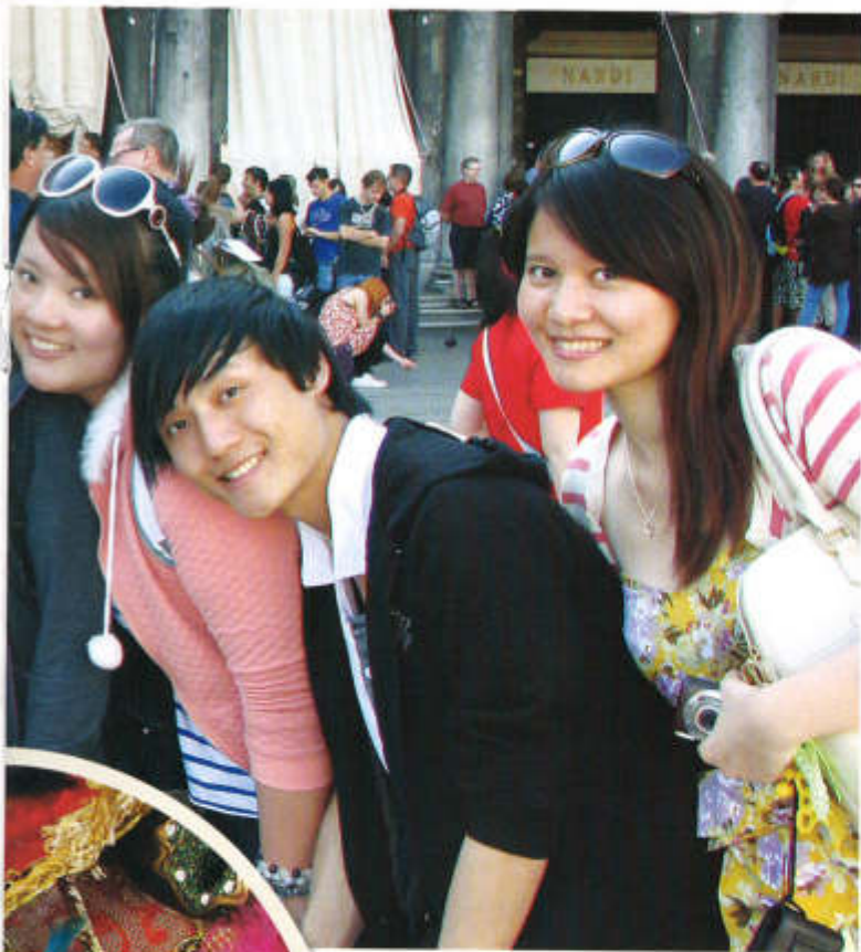
◀ Маска, я тебя знаю!