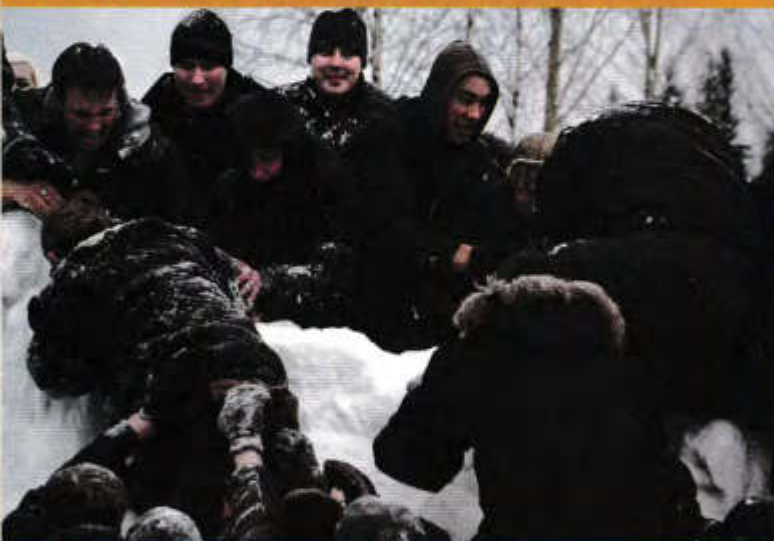
▲ Масленица. Штурм

Самые первые сделанные им фотокарточки, конечно же, не представляли художественной ценности – он щелкал все подряд, постигая азы съемки. Но с каждым годом уровень мастерства рос, появилось более осмысленное и четкое видение кадра. Он начал принимать участие в городских фотовыставках, а не так давно в Архангельске прошла уже персональная выставка его работ. Но, пожалуй, самым заметным событием для него как фотохудожника стало то, что два его снимка были отобраны – в числе 365 других – для экспозиции «Лучшие фото России 2008 года», которая демонстрировалась в московской галерее «Винзавод».