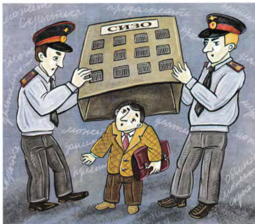
Рис. Софья Бестужевой

Юрий ПРЕМИЛОВ, член совета Адвокатской палаты Ивановской области, заместитель председателя Ивановской областной коллегии адвокатов