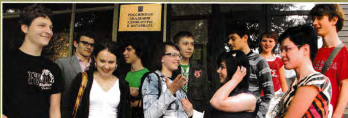
▼ Скоро станем студентами

Юлия ОНАЦКАЯ, спецкор «Российского адвоката»