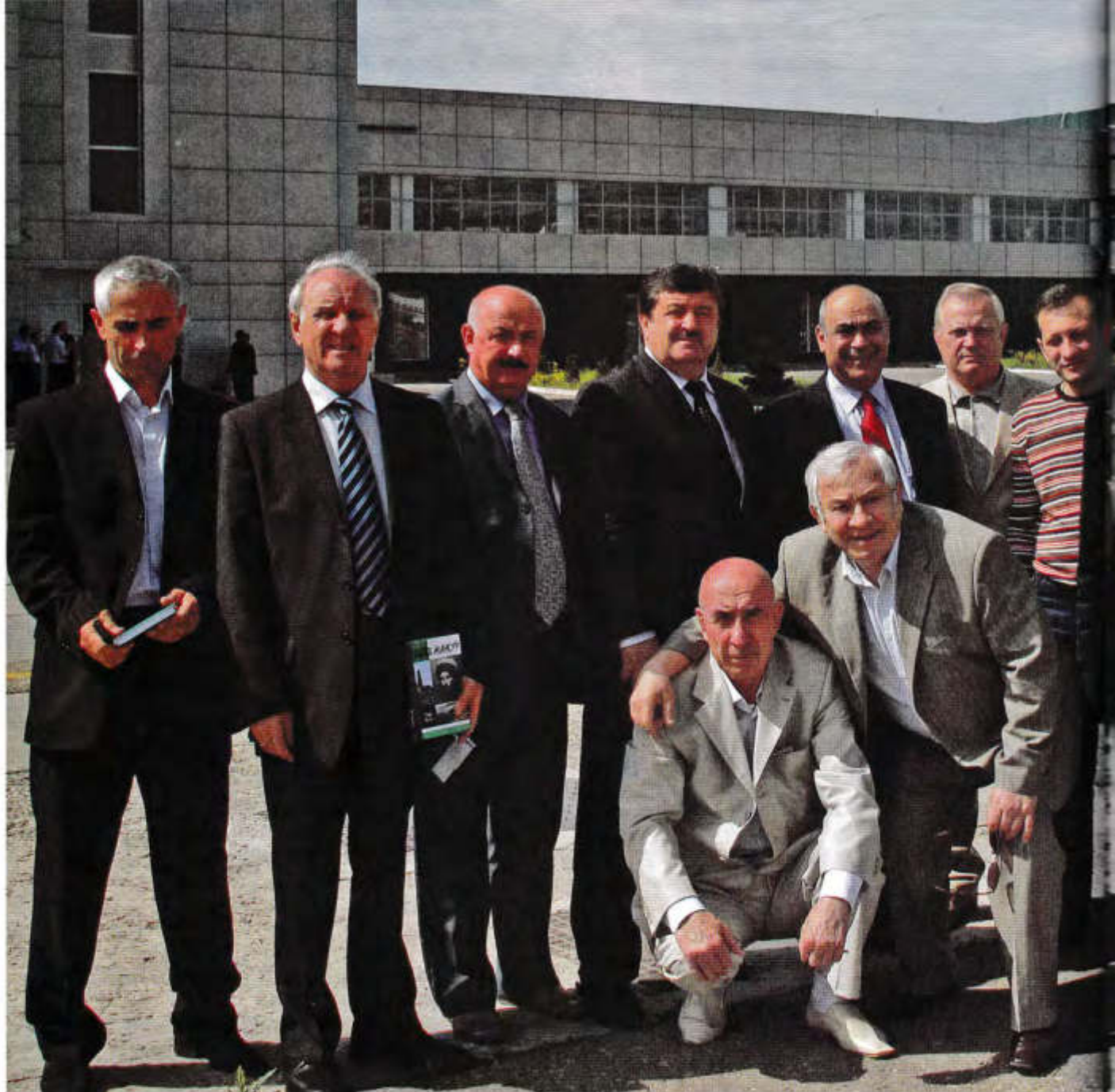
▲ До встречи, Грозный!

поток были поставлены сплошь обвинительные приговоры. И фактически оправдать человека в то время означало бросить своего рода вызов системе. Судья Слободкин тем не менее пошел на это. О чем он думал в часы, когда писал тот приговор, знает лишь он один. Но сие имеет, как говорится, прикладное значение. Главное – сам поступок, вызвавший восхищение не только юридической общественности.