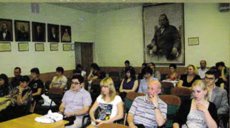
▼ Родители тоже интересовались будущей альма-матер своих детей

Не в первый раз в Российской академии адвокатуры и нотариата проходит день открытых дверей. Более 20 абитуриентов со своими группами поддержки (а это родители, друзья, просто знакомые) заполнили актовый зал почти под завязку – ведь многие пришли с твердым