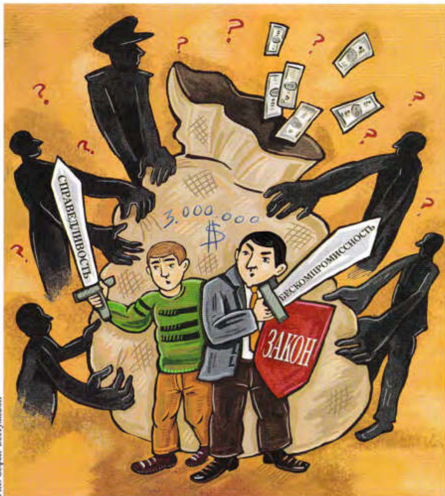
Рис. Софья Бестужевой

Галина МЫЛЬНИКОВА, спецкор «Российского адвоката»