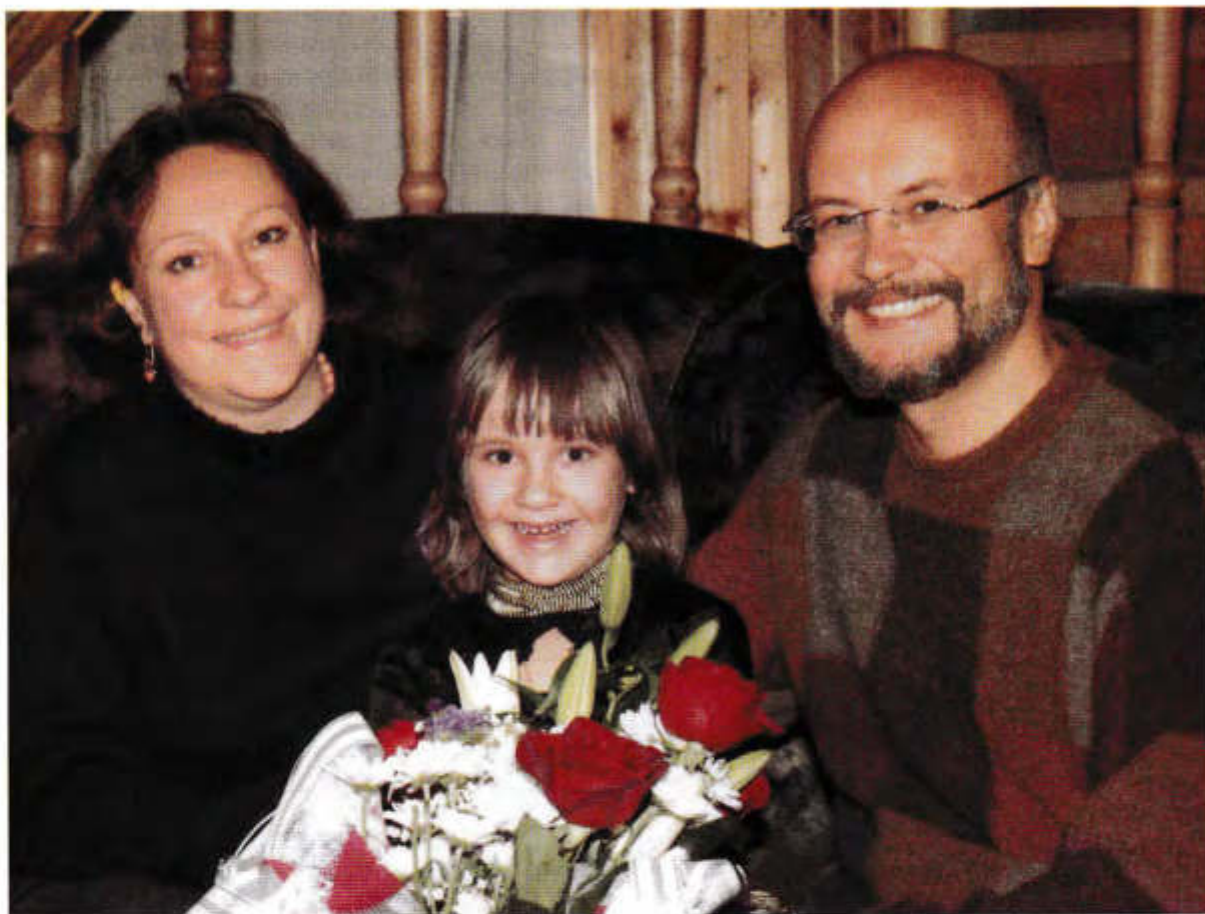
▲ Наша дружная семья