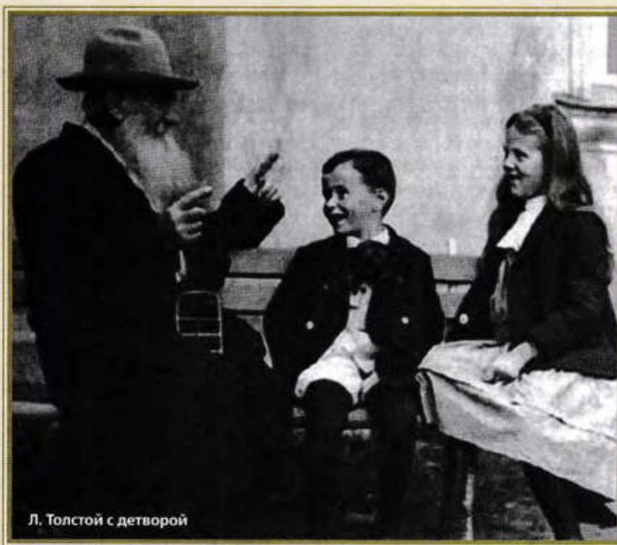
Л. Толстой с детворой