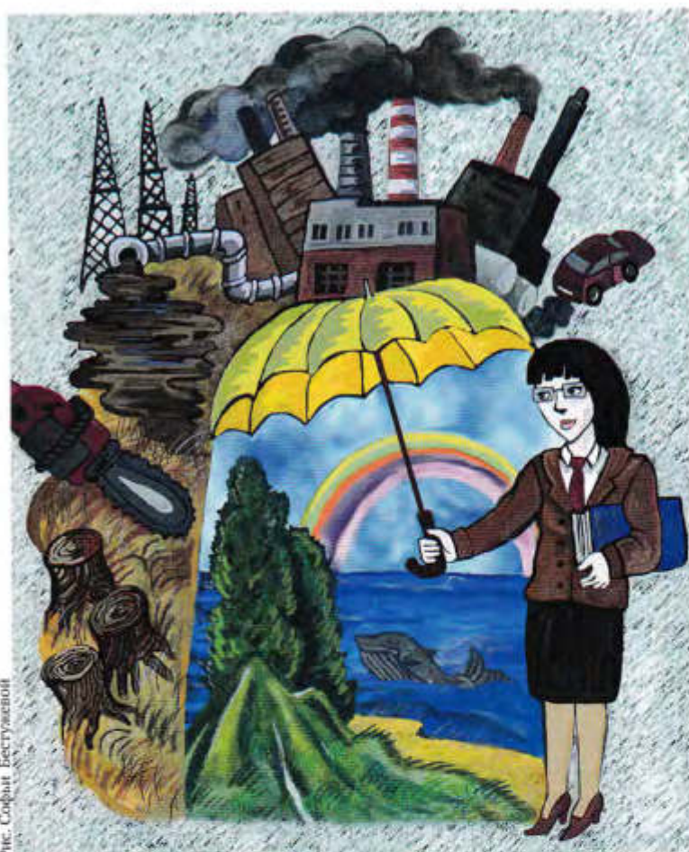
Рис. Софий Бегуяновой

Решением суда первой инстанции наши исковые требования не были удовлетворены, а кассационная жалоба была возвращена судьей даже без вынесения определения об отказе. Но мы все-таки добились возобновления разбирательств. Когда мы ожидали в суде начала очередного заседания, нам позвонили коллеги и сообщили, что компания приняла решение перенести трубопровод, удалив его от пастбища китов. Спустя пять часов нас пригласили-таки в зал, где судья огла-