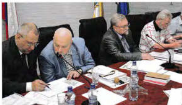
▲ Президиум Совета ФПА