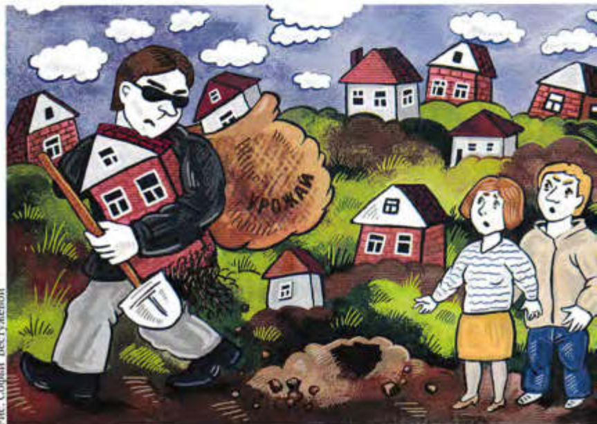
Рис. Софист Бесчужевой

Роман КРУГЛОВ, почетный адвокат России, специальный корреспондент «Российского адвоката» в Государственной думе ФС РФ