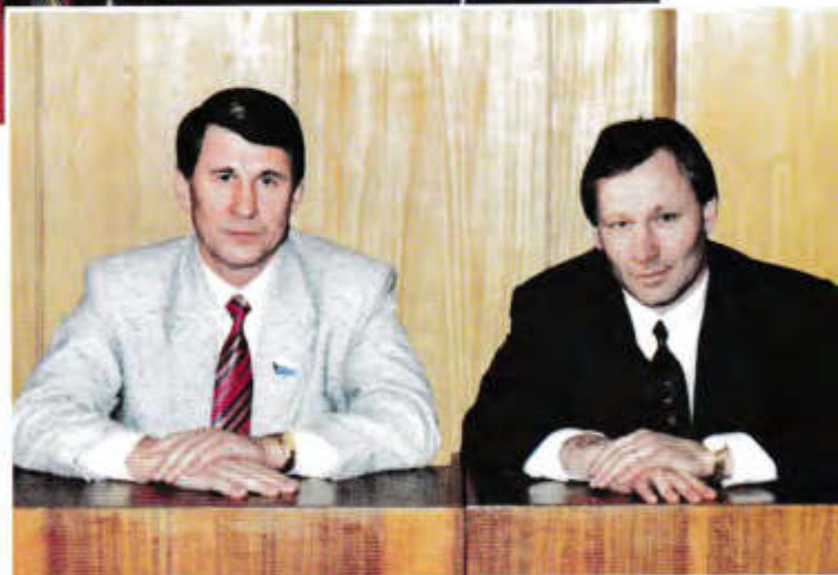
▲ С Героем Советского Союза генералом Виталием Бубениным

Мало кто из живущих или приезжающих в Хабаровск не побывал хоть раз у памятника «Черный тюльпан» на берегу Амура. Кажется, что этот рвущийся среди камней к солнцу цветок, пробитый пулей, всегда находился на этом месте, олицетворяя собой жизнь вопреки смерти и напоминая нам о тех, кто во