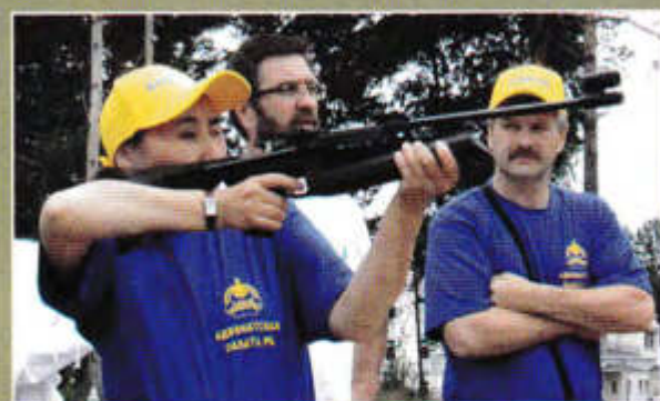
▲ Точен глаз потомственной охотницы из Бурятии