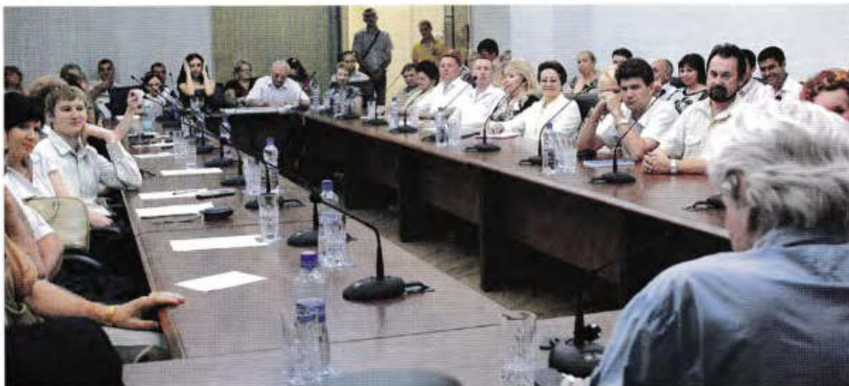
▲ Идет заседание