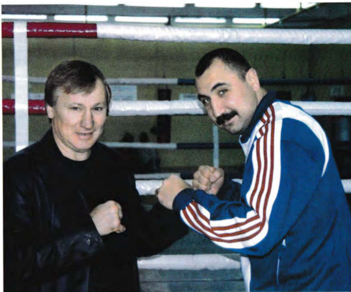
▲ «Спарринг» с олимпийским чемпионом Александром Лебзяком