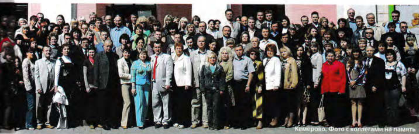
Кемерово. Фото с коллегами на память