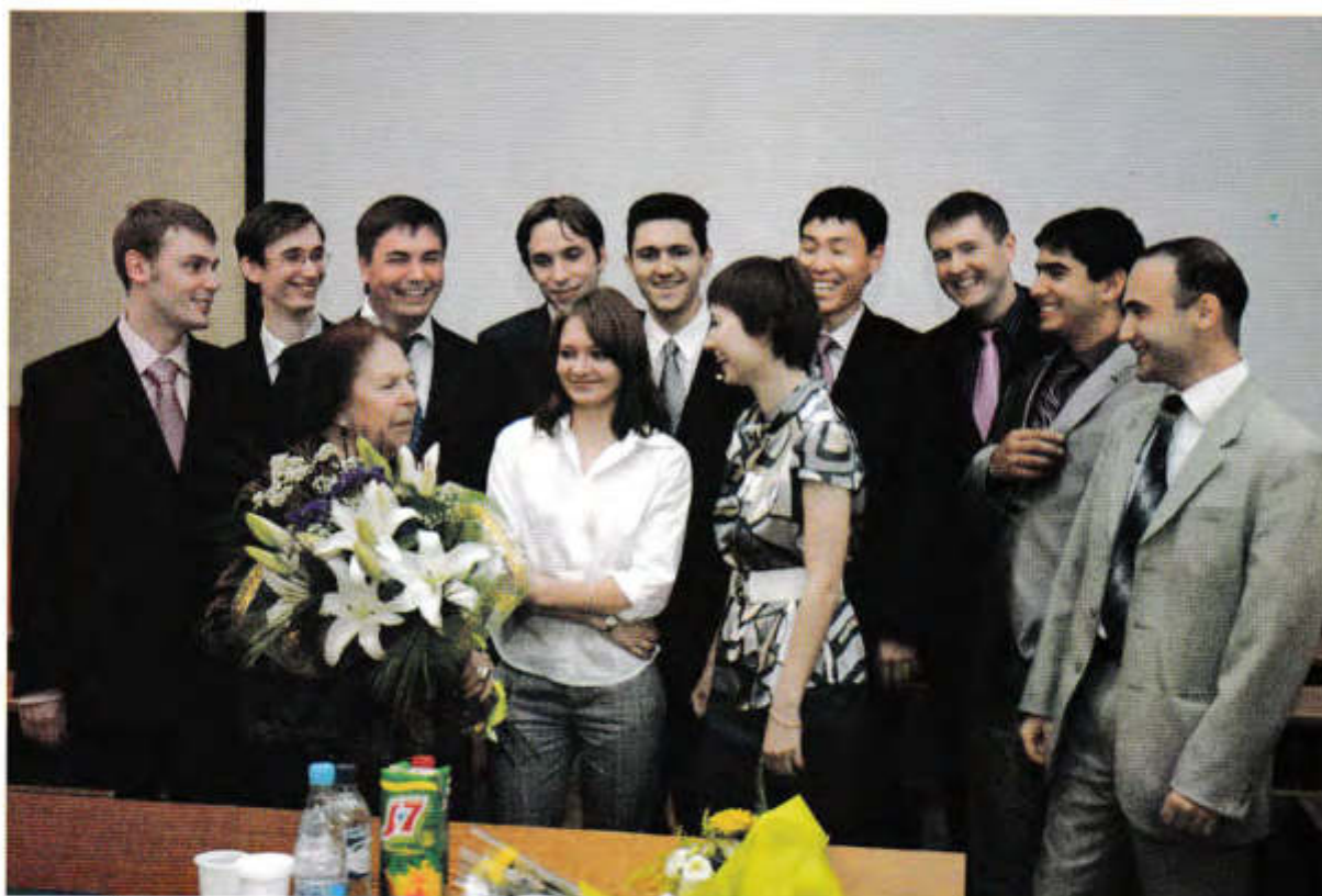
▲ Спасибо за знания!