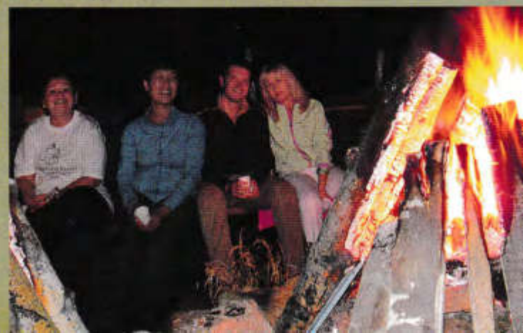
▼ Костер дружбы