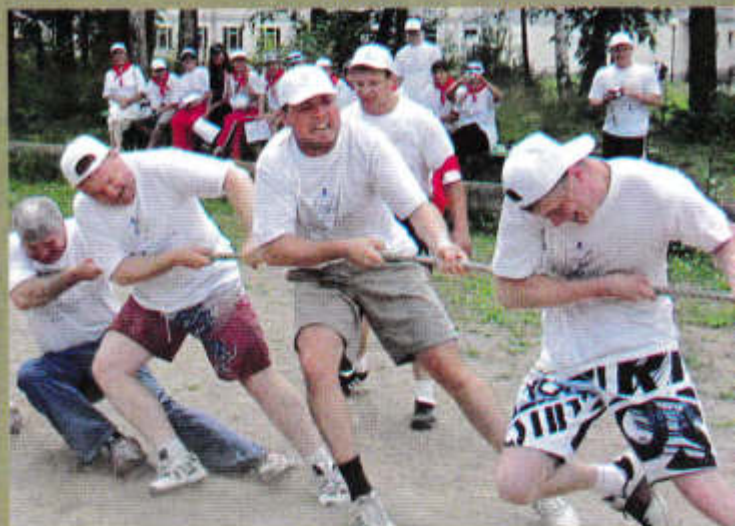
▲ Есть еще порох...