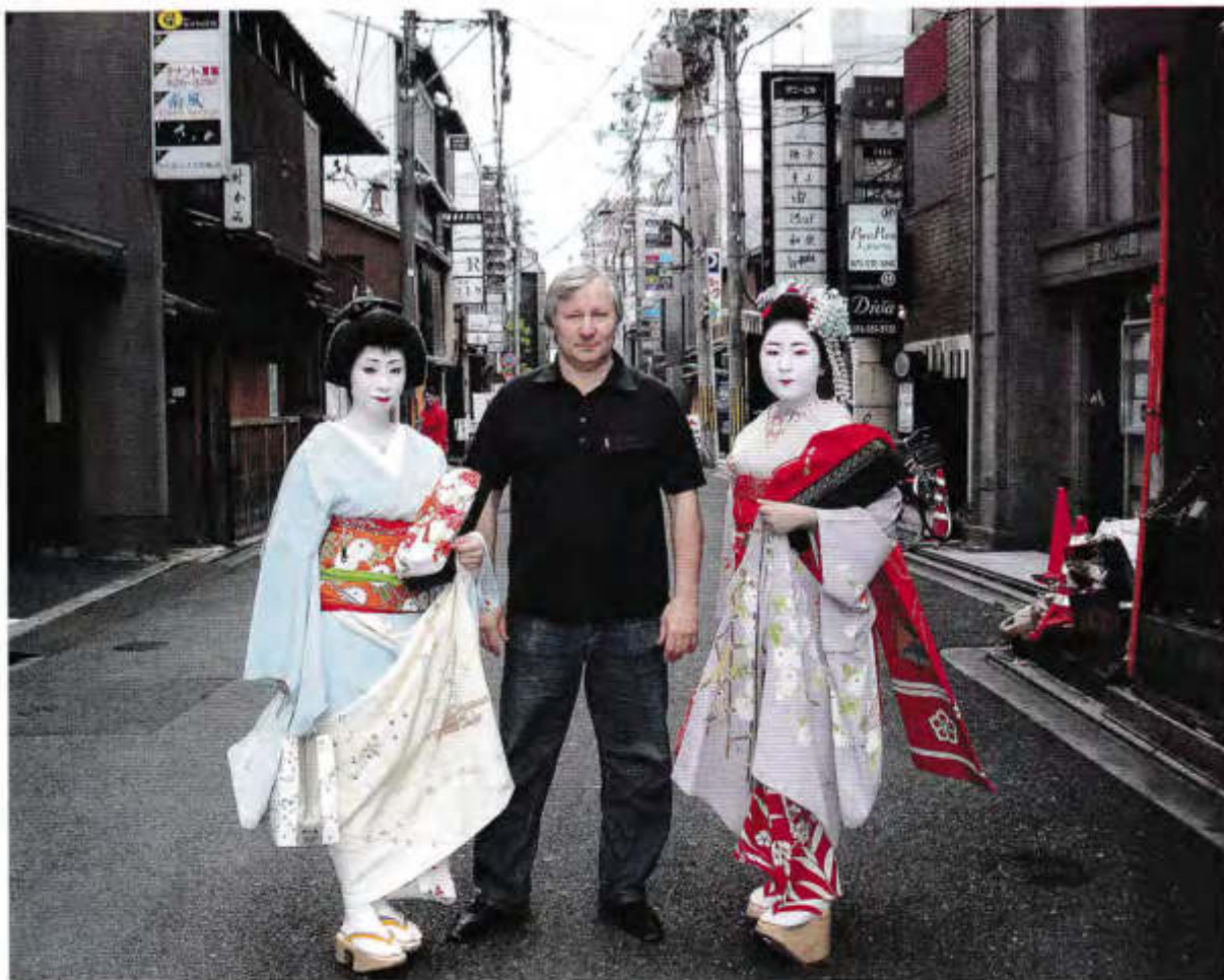
▲ На улицах Токио