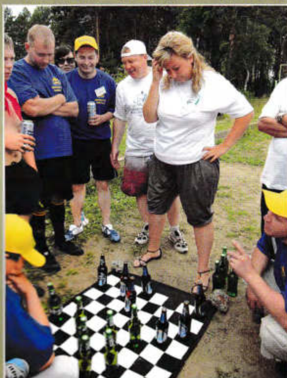
▼ Надеемся, ФИДЕ зарегистрирует этот вид шахмат