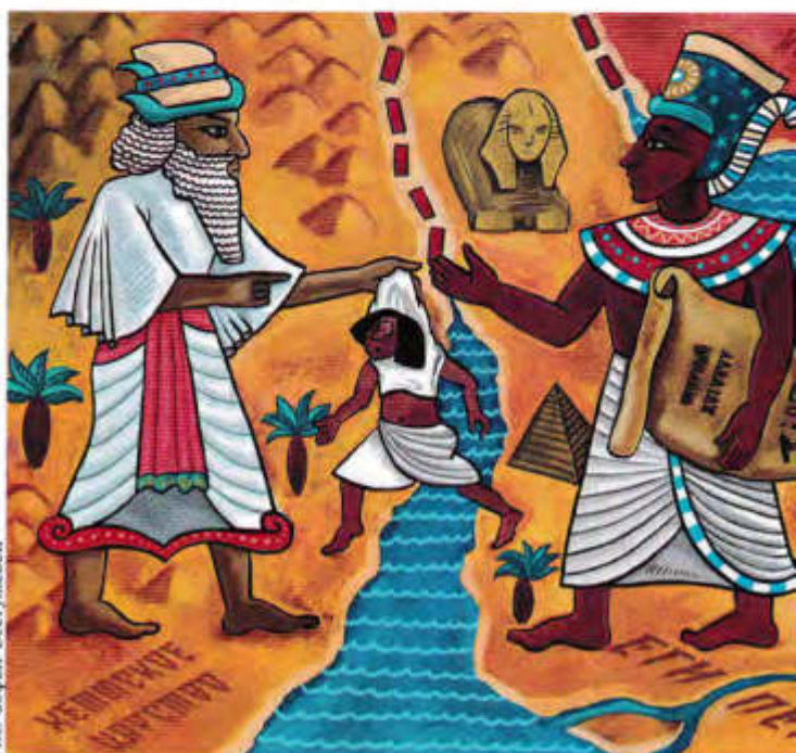
Рис. Софья Бестужевой

Михаил СТЕПАНОВ, заведующий филиалом № 11 Московской областной коллегии адвокатов, почетный адвокат России