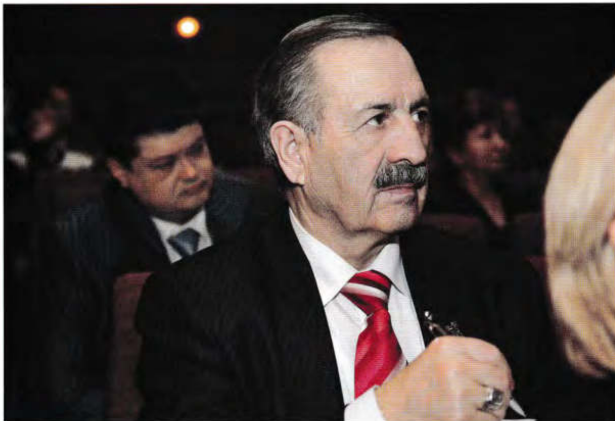
РАШИД ТЕУНАЕВ, президент Адвокатской палаты Карачаево-Черкесской Республики