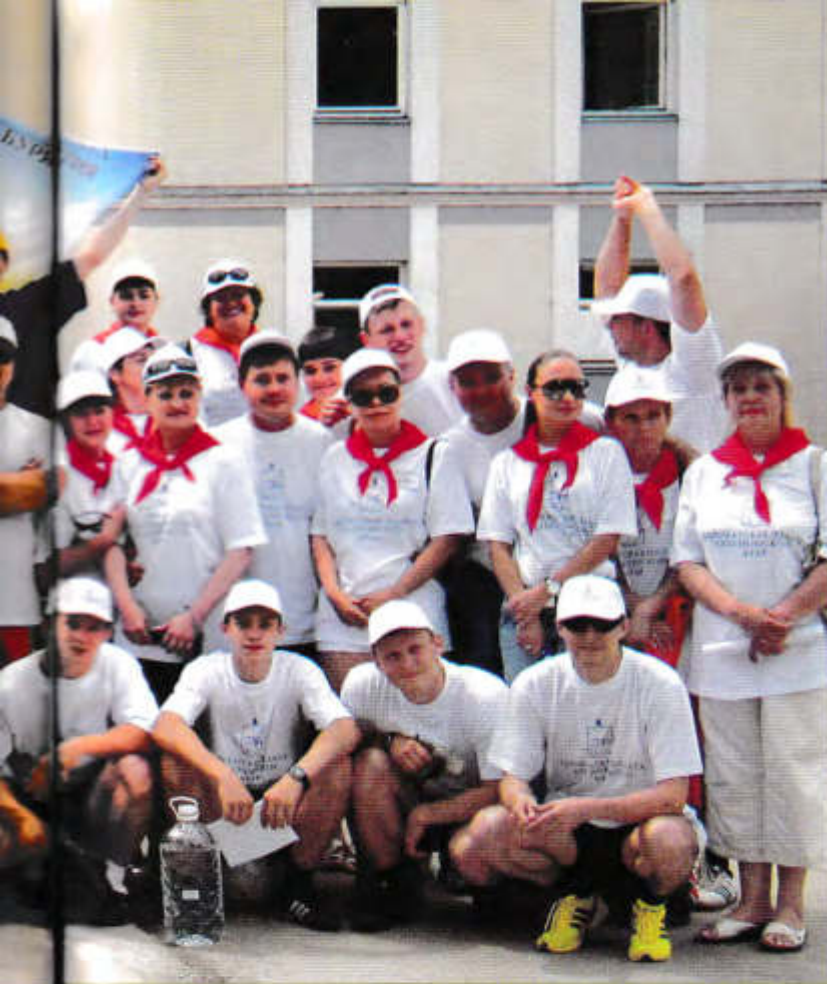
▲ Встретились друзья-соперники