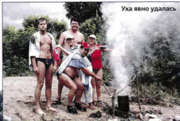
Уха явно удалась

А самое главное – впечатлений море и отдых на славу.