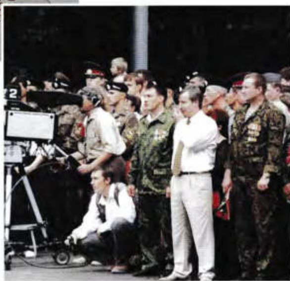
▲ Среди воинов-«афганцев» на открытии памятника «Черный тюльпан»