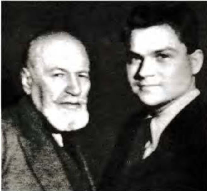
С В.И. Немировичем-Данченко

сенным творчеством сегодня? Ведь какие бы ни случались в стране коллизии, как тяжело ни приходилось бы народу, мы всегда пели.