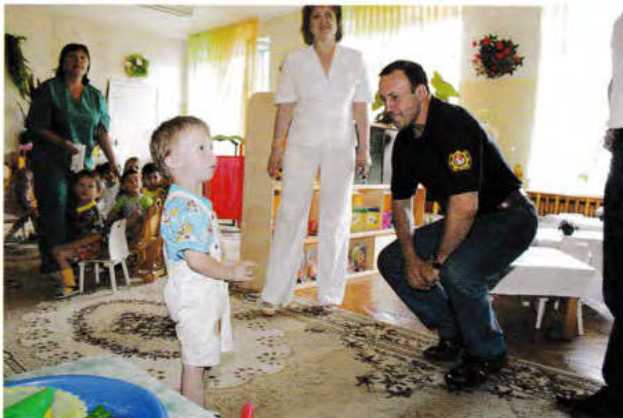
Расскажи-ка мне, дружок...

В Соловках вместе с ними поражался тамошним соборам и скитам, неведомым ему «самым