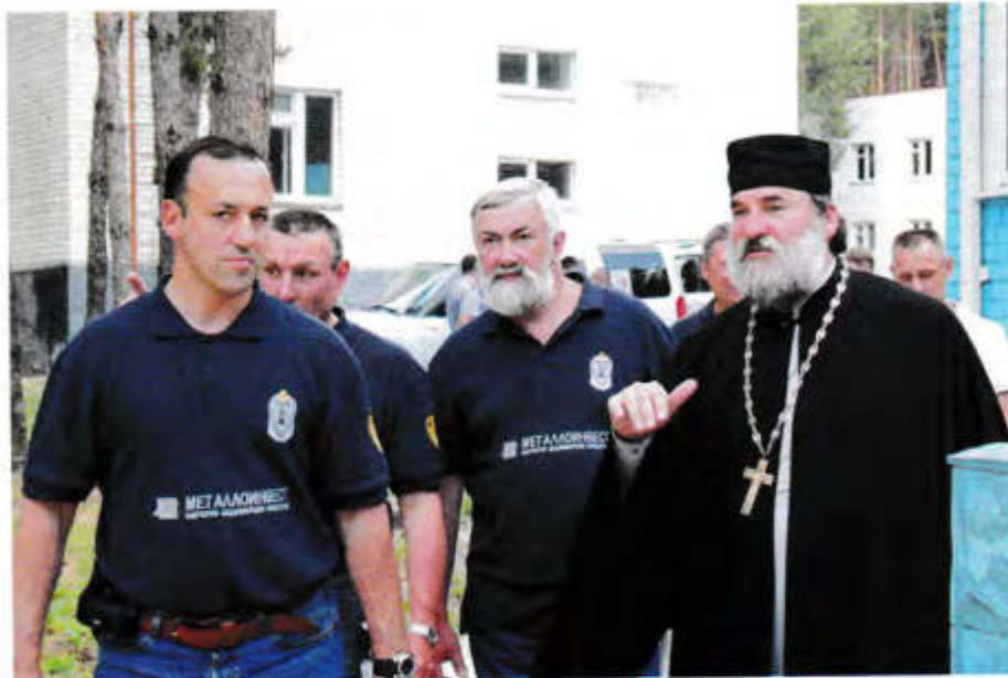
С верой в сердце

большие разовые пособия семьям, потерявшим кормильцев, поминальные молебны по погибшим, вручение учрежденного «Честью» ордена известнейшего российского сыщика А. Ф. Кошко лучшему сотруднику местного уголовного розыска?