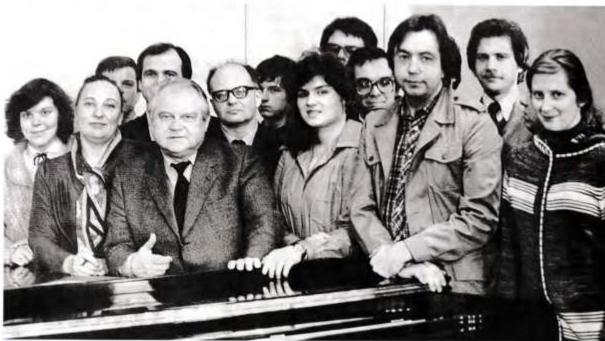
Среди студентов Московской консерватории

– А как, на ваш взгляд, обстоит дело с пе-