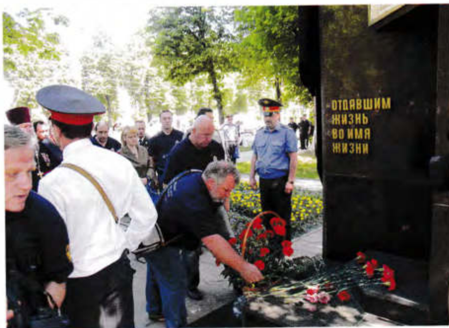
Мы помним о вас...