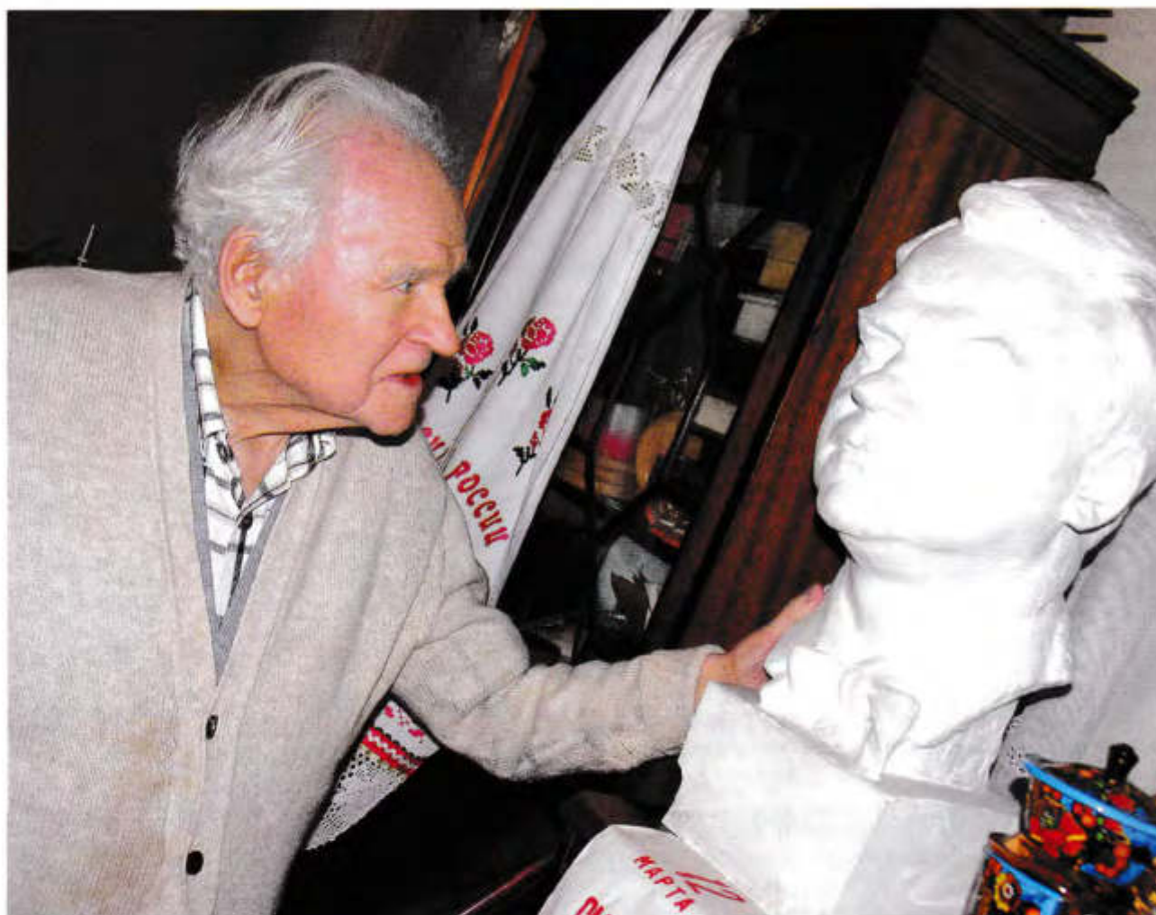
Встреча с прошлым