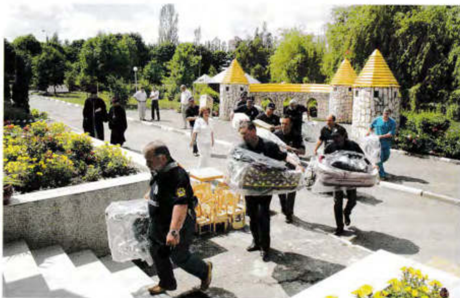
Помогаем, чем можем

Сделанное ими действительно можно оценивать порозному. Если в рублях-долларах, это, понятно, несопоставимо с затратами на подарки друг другу современных олигархов и их приспешников. Ну в какое сравнение с роскошнейшими ролс-ройсами, яхтами идут детские коляски, обувь для ребятшек из детдома, компьютеры в интернат для детей-инвалидов, не-