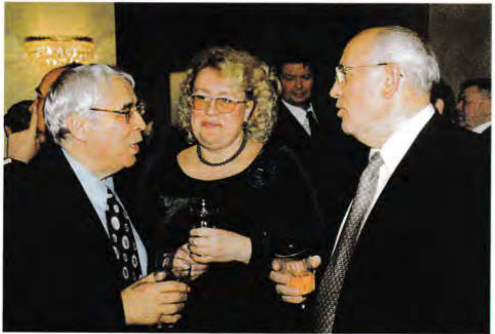
С Михаилом Горбачевым мы всегда дискутируем ▲

мы я абсолютно не принял. Критиковал их, лично Бориса Николаевича, хотя, быть может, нужно было воздержаться. Не вошел ни в одну из партий, но мог бы создать свою, социал-демократическую (Алексеев, Шаталин и я). Однако не сделал этого, чтобы не мешать Горбачеву подняться над ситуацией.