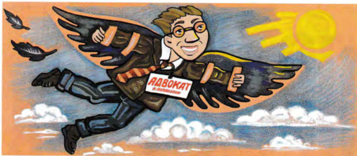
Рис. Софьи Вестуженой