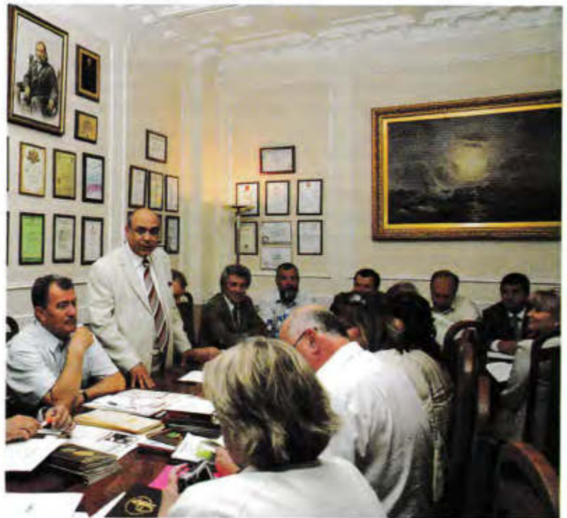
Идет заседание Исполкома Гильдии российских адвокатов ▲

Свидетельство тому – ситуация с созданием так называемых государственных юридических бюро. С са-