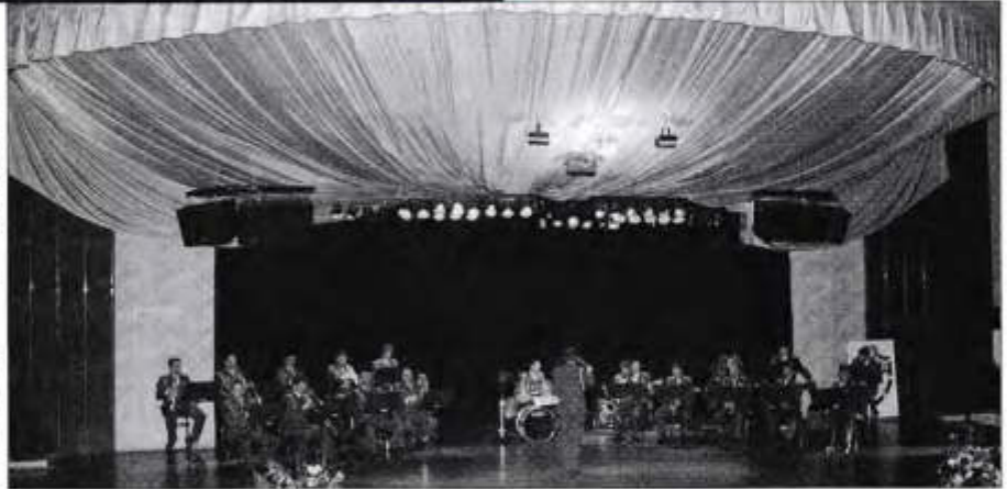
Юбилея приветствуют военные музыканты