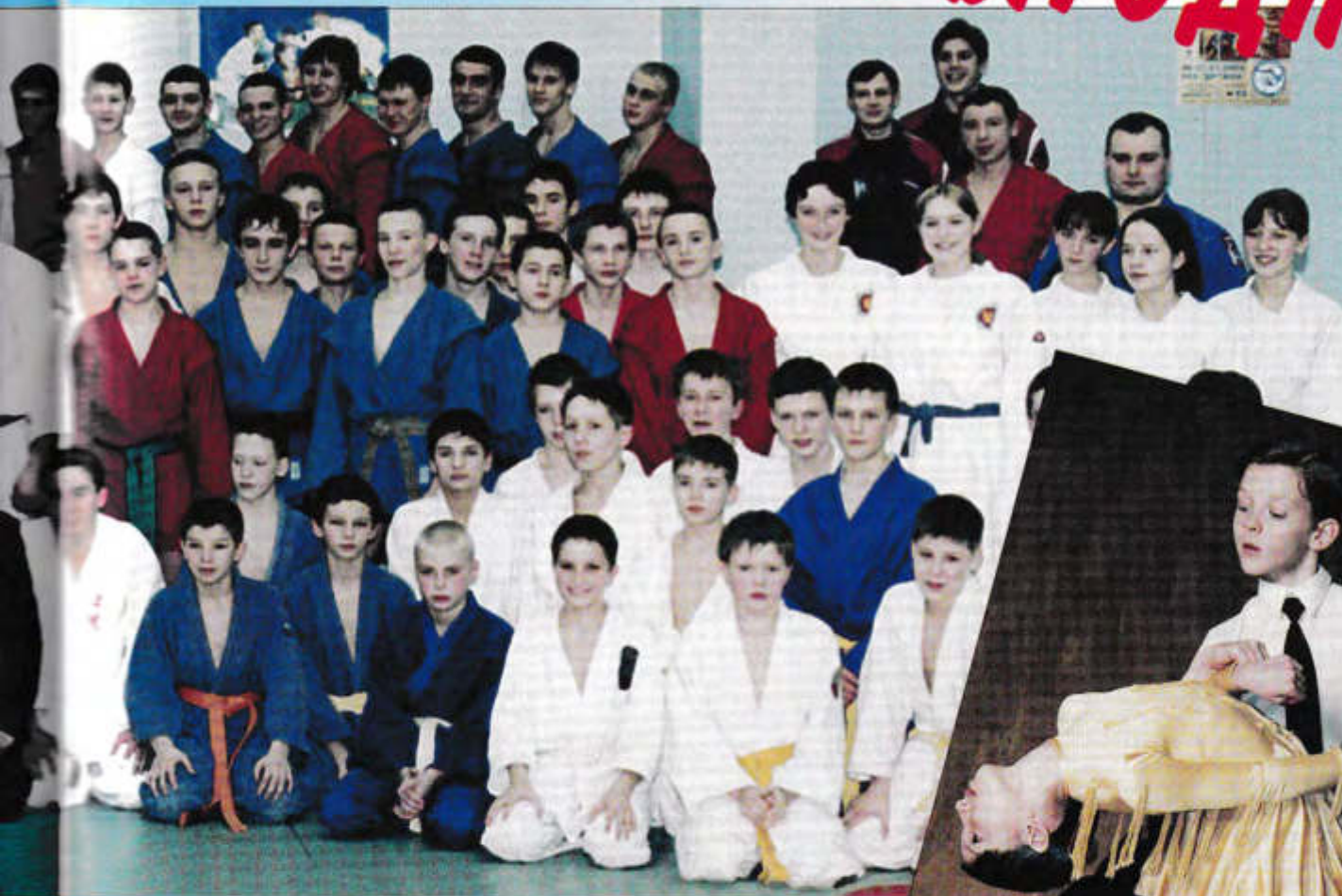
Команда молодости нашей