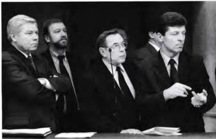
В Государственной Думе РФ. Идет голосование

ву, об этом шла речь и в Послании Президента России. Ведь, скажем, часто судья санкционирует арест гражданина не в силу своей убежденности в необходимости этого, а потому, что иного решения не предусматривает закон. Например, при повторном совершении преступления, даже не столь тяжкого... Между прочим, у нас выносятся, казалось бы, не так уж и много приговоров, связанных с лишением свободы, около 35 процентов. Но у нас, согласно официальной статистике, на 100 тысяч человек населения преступность меньше, чем в Европе или Северной Америке. А по численности «тюремного населения» на те же каждые 100 тысяч человек мы на одном их первых мест среди этих стран. Так что проблема обвинительного уклона, конечно, существует, но она многолика и решать ее можно лишь комплексом мер.