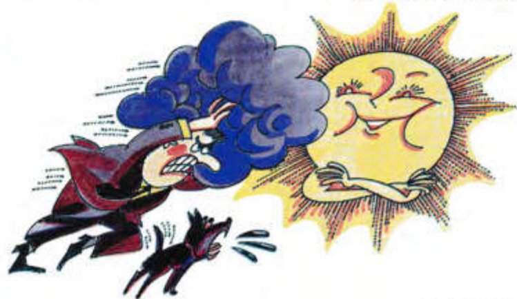
Рис. Леонида НАСЫРОВА