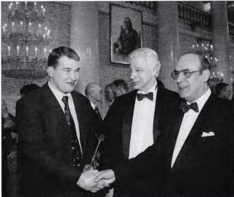
Президент «Попечителя» – почетный адвокат России

«Мы получили все, что вы нам дарили: нижнее белье, конфеты, вашу любовь к нам... Хоть и стыдно, но у некоторых в жизни не было собственного нижнего белья. Пусть Господь всегда будет с вами в ваших добрых делах!»