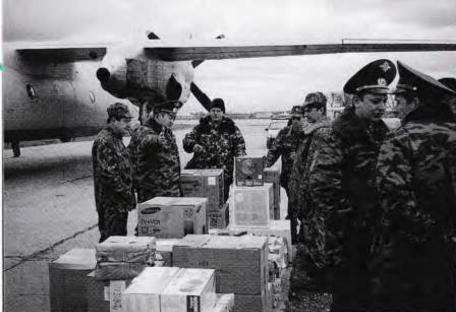
Гуманитарный груз прибыл в Ханкалу

несут службу, решают боевые задачи, общаются, интересуются новостями с «большой земли».