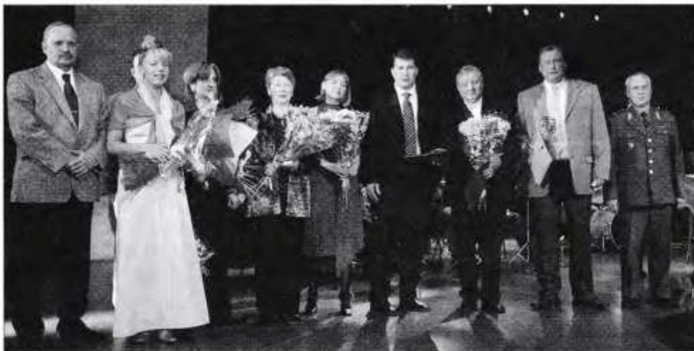
Дружная команда «Попечителя»

Валерий РЯЗАНЦЕВ, спецкор «Российского адвоката»