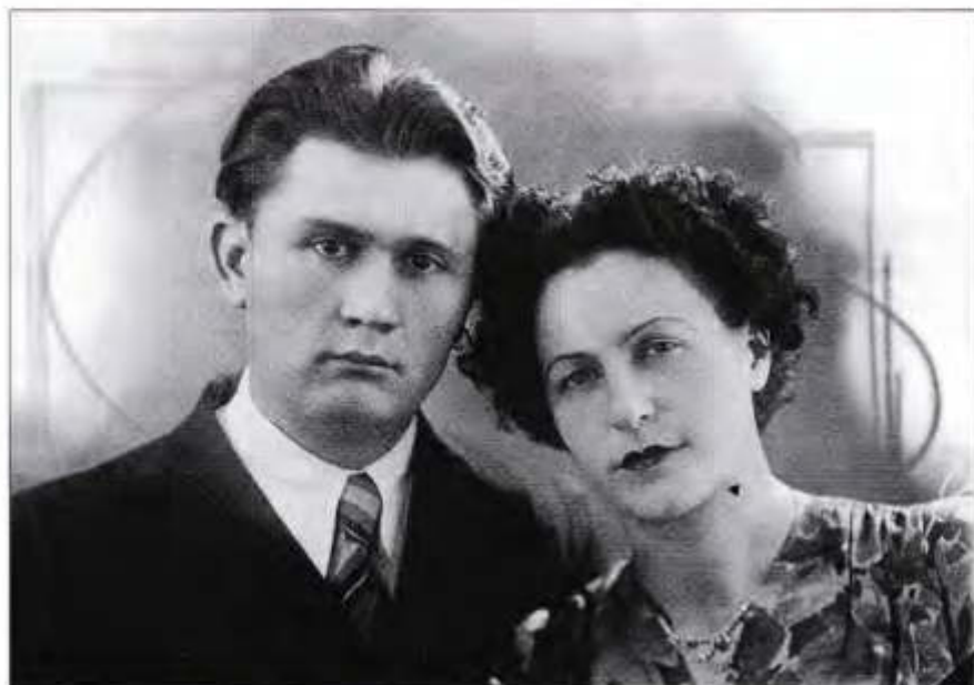
С мужем. Такими они были в 1955-м

вторную экспертизу, но его отклонили. Хотя, судя по ряду косвенных доказательств, майор, будучи в нетрезвом состоянии, сам инициировал аварию. Вместе с