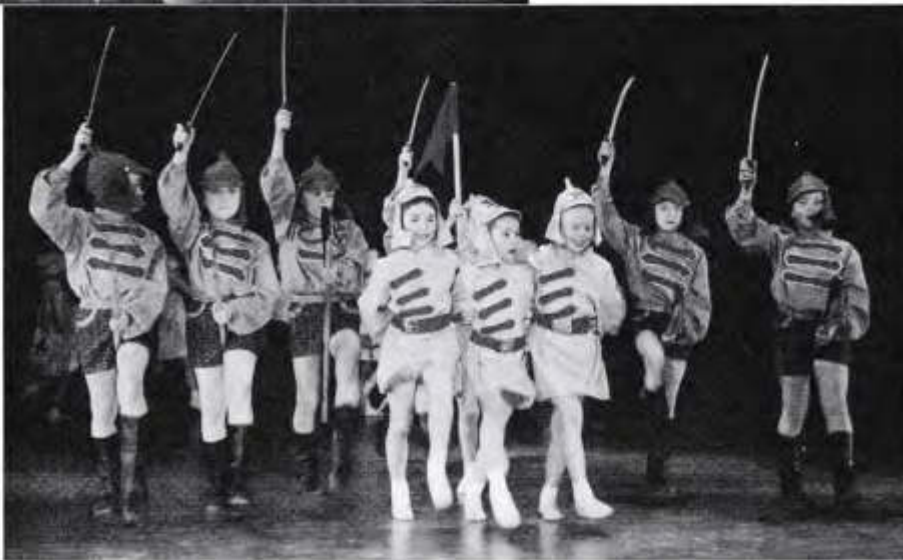
Эх, тачанка-ростовчанка... Сценка-поздравление из удивительного спектакля детского ансамбля МВД

Но все это опять же, под каким углом ни смотри, решение общезначимых проблем частным порядком неравнодушными людьми за свой счет. А вот заинтересованности государства в том, чтобы создать на крепкой правовой основе стройную систему благотворительной поддержки собственных социальных программ, пока не разглядишь и в морской бинокль. И крутятся энтузиасты добра, словно белка в колесе, на орбите не таких уж и масштабных личных возможностей.