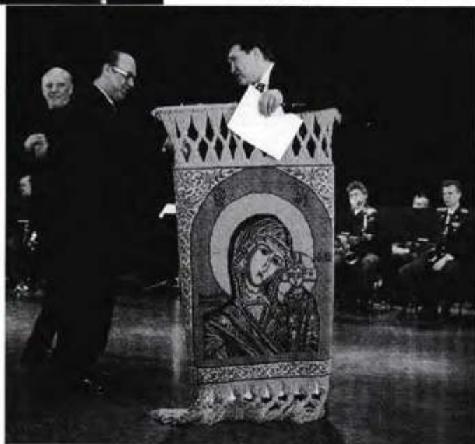
Икона Казанской Божией Матери – от Гильдии российских адвокатов

дотворно работающий коллектив энтузиастов-единомышленников. Более того, это совершенно новое явление в нашей социальной сфере, в отношениях между человеком и обществом, бизнесом и государством.