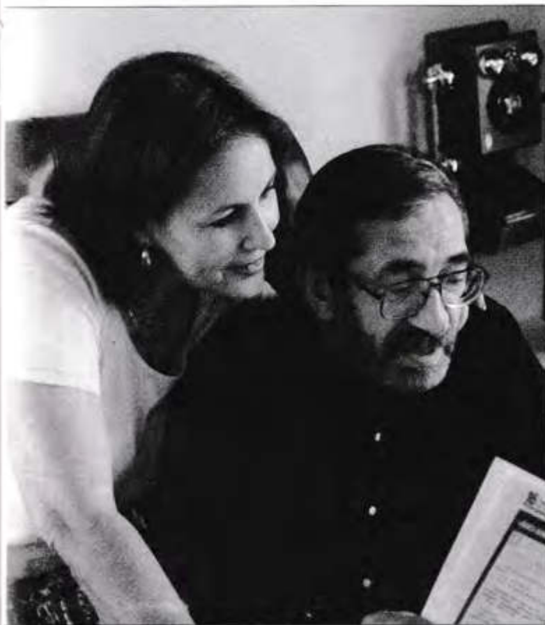
«Наденька – главный источник моего вдохновения»

– Это больше, нежели хобби. Я романтик, а это море. Флот. Я человек рискованный, а это – по вантам на форс-марс, ставить и убирать паруса... У меня не просто фрегат – это настоящий фрегат «Надежда». Я объясняю своим гостям, что Москва-река изменила русло, фрегат оказался на суше в березовой роще, а дом я к нему пристроил. Верят. Ведь даже пушки настоящие.