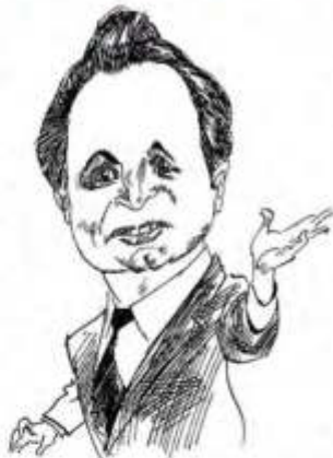
Рис. Леонида НАСЫРОВА

— В буфете барышня на меня уже не смотрела, а если и смотрела, то в упор меня не видела. Спасибо ее подруге. Подошла ко мне и утешила: «Вы не первый, кого разыгрывает моя подружка, когда ей спектакль не нравится». Можете представить выражение моего лица: будто я съел лимон. Но не после рюмки, а до.