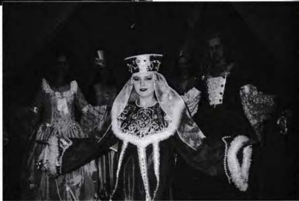
Эти костюмы девчонки «изобретали» и шили сами