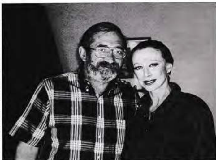
С Майей Плисецкой