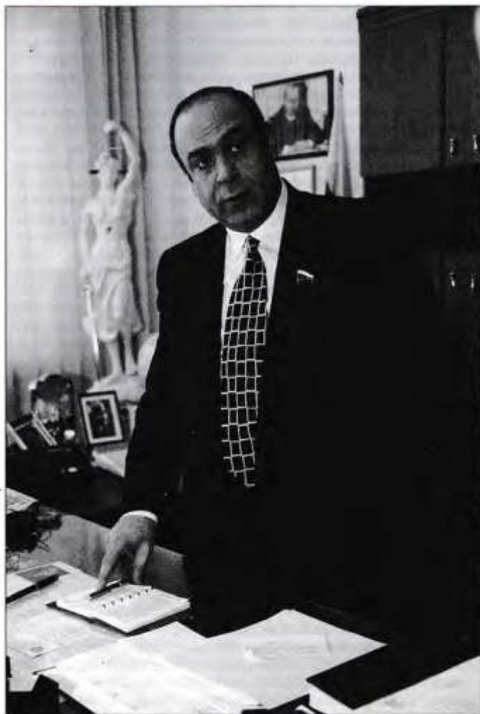
Гасан МИРЗОЕВ , президент Гильдии российских адвокатов, депутат Государственной Думы РФ

НОВЫЙ ЗАКОН НЕ ИДЕАЛЕН, НО ДОЛЖЕН УСТРОИТЬ ВСЕХ