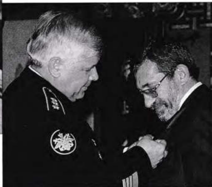
За заслуги перед флотом

– На заре моей адвокатской юности у меня было больше оправдательных приговоров, чем у всей Магаданс-