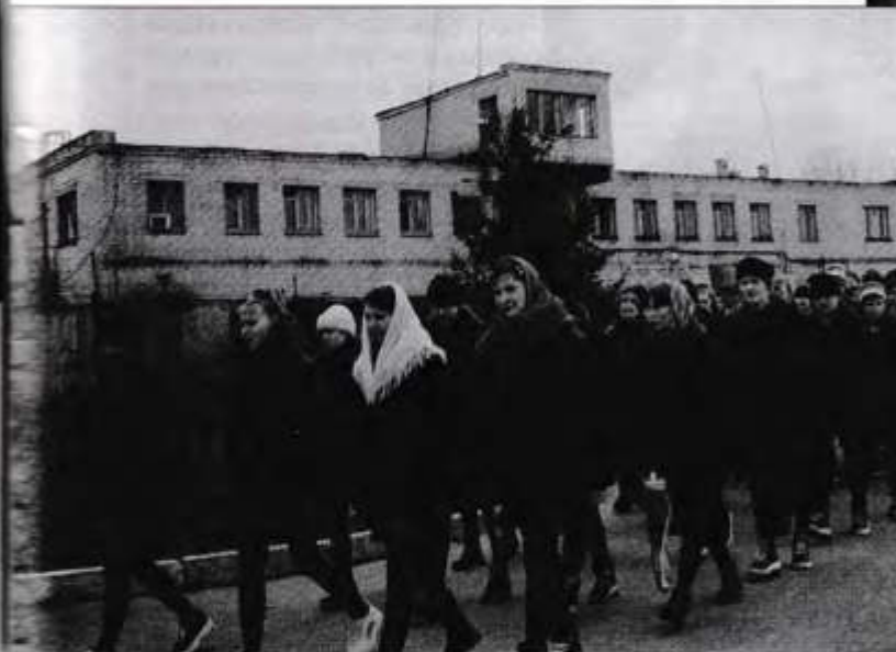
Передвигаться по колонии приходится строем