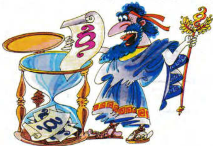
Рисунки Леонида НАСЫРОВА