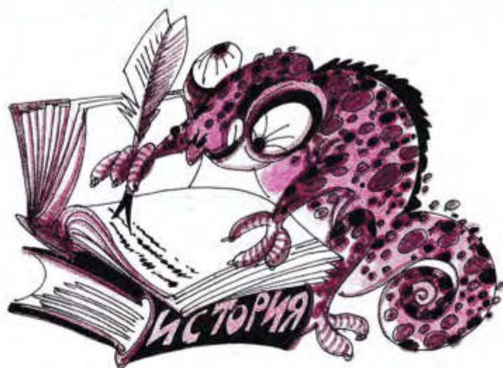
Рисунок Леонидо НАСИРОВА

Начало нынешнего учебного года ознаменовалось острой дискуссией вокруг школьных учебников по отечественной истории. Как избежать в них предвзятости, излишней политизированности? Оно вроде бы понятно: в учебниках должно быть поменьше оценок и побольше фактов. Да ведь ясно и то, что один и тот же факт в изложении, допустим, либерала прозвучит совсем не так, как в изложении коммуниста.