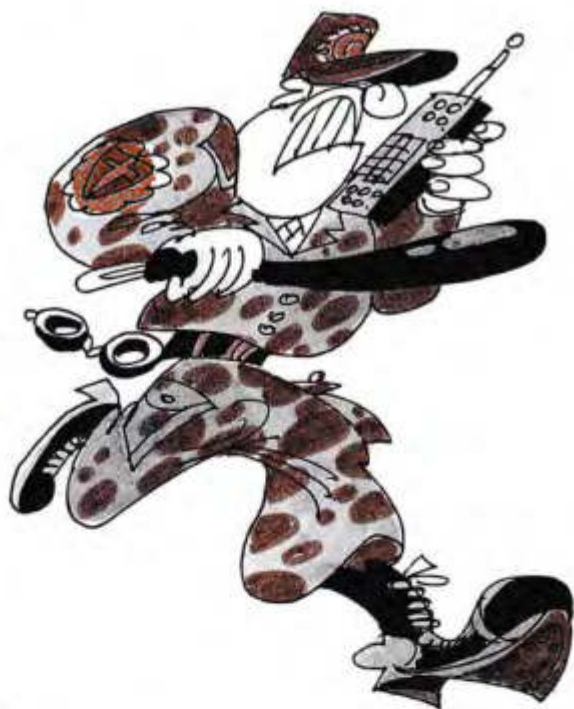
Рисунок Леонида НАСЫРОВА