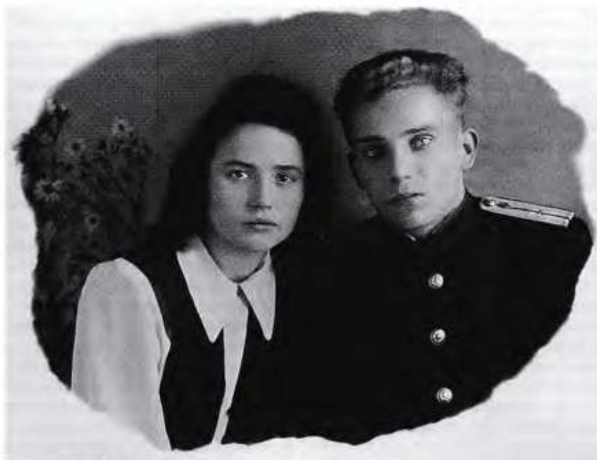
Счастливые молодожены (Кировская обл., 1952 г.)

жить об очередном раскрытом тяжком преступлении. Судья даже вынужден был закрыться в своем кабинете, отключив телефон и не принимая посетителей. Но «номер» не прошел: суд вынес оправдательный приговор.