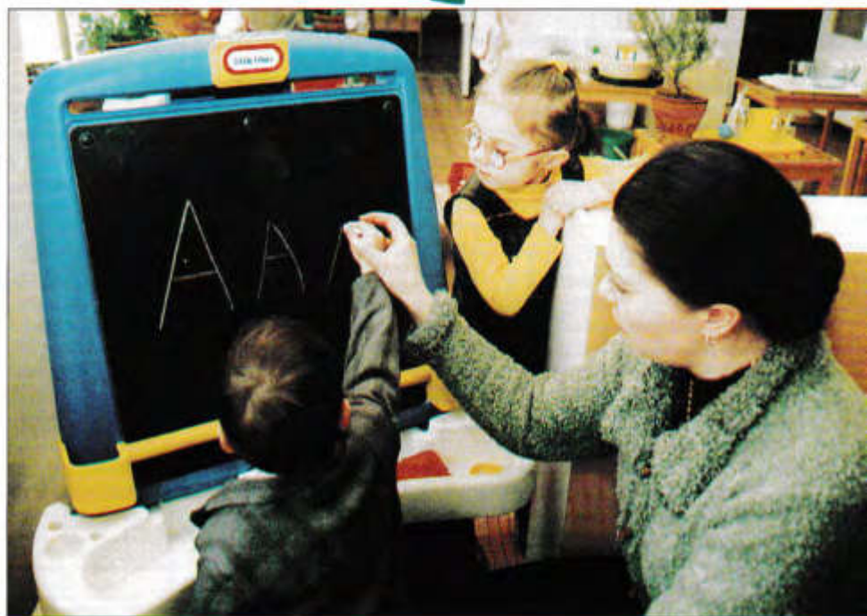
Черточка к черточке – «А» получается