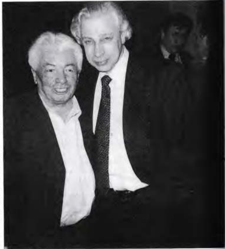
2001 год. Москва. С писателем Владимиром Войновичем

Следующее мое ходатайство: разрешить пользоваться диктофоном. Опять отказ. С занятой мотивировкой: в диктофоне нет нужды, поскольку ведется протокол судебного заседания. Это уже откровенная издевка. Протокол судебного заседания – непроходящая головная боль советских, теперь российских, адвокатов. Единственный процессуальный документ, фиксирующий ход судебного разбирательства, – протокол не только вечная жертва неточных записей секретаря – недавнего выпускника средней школы, но и предмет постоянной фальсификации, подгонки под вынесенный (иногда еще до судебного