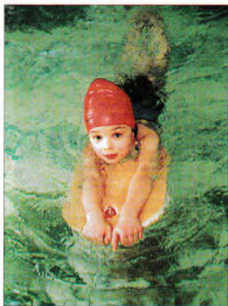
Вперед – без страха и сомнений