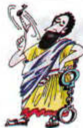
Рисунок Леонида НАСЫРОВА