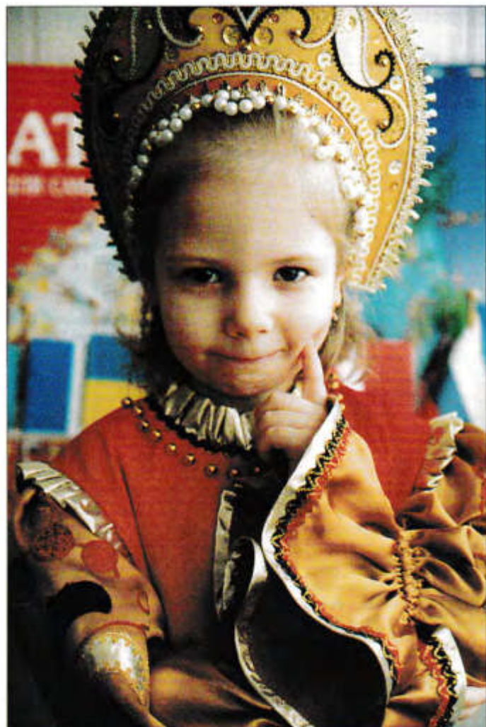
«Мисс» 1775-го – русская красавица