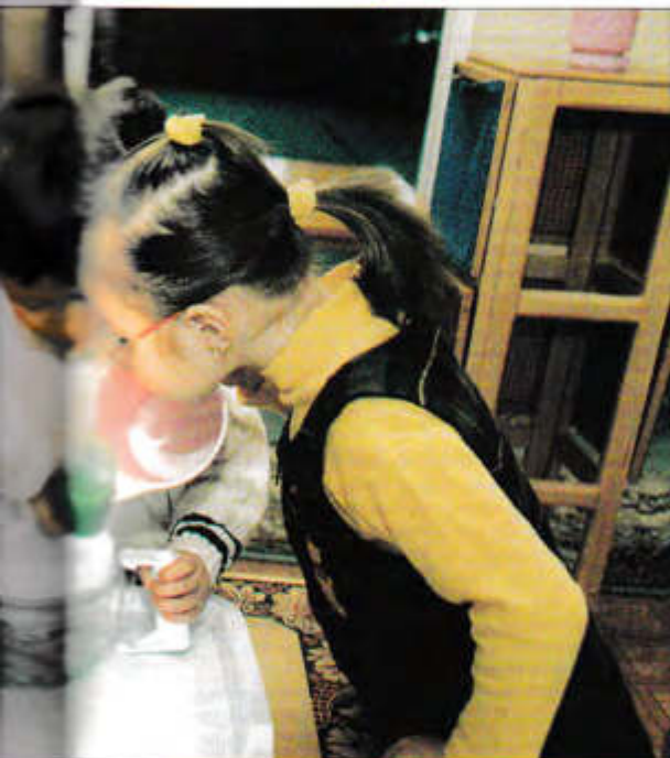
Три подружки над столом...