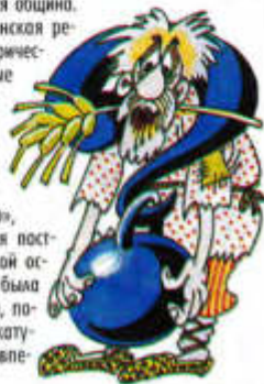
Рисунок Леонида НАСЫРОВА

Тем не менее крестьянская реформа сыграла свою историческую роль. Открылись новые возможности для расширения рыночной экономики. Вовлечение в активный общественный процесс миллионов крестьян, получивших «волю», дало мощный толчок для построения на цивилизованной основе правовой системы – была проведена реформа суда, появились нотариат и адвокатура. Но об этом рассказ впереди.