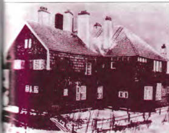
Дом писателя в Ваммельсуу (Финляндия)

Григорий АЛЕКСАНДРОВ, спецкор «Российского адвоката»