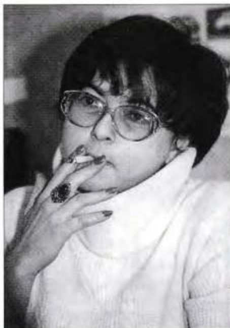
Думай, адвокат, думай...

— Гонки на выживание, — говорила Лариса Абрамовна, — это своего рода слепок с нас самих. Рвемся к какой-то полупрозрачной цели, сшибаемся лбами, толкаемся локтями, опустошаем кар-