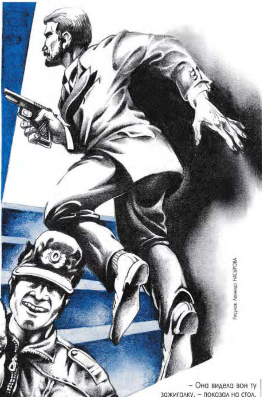
Рисунок Леонида НАСЫРОВА

– Где же твоя пушка, топтун? – недовольно спросил подполковник. – Лифтерша ее видела!