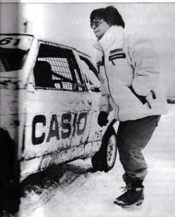
Впереди – крутые виражи