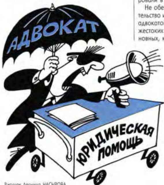
Рисунок Леонида НАСЫРОВА

Конкретные пути выхода из кризиса могут, на мой взгляд, обсудить очередной съезд адвокатов России. К сожалению, такой форум давно не собирался. Думаю, сейчас самое время исправить эту ошибку. Большинство адвокатов, уверен, разделяет эту позицию.