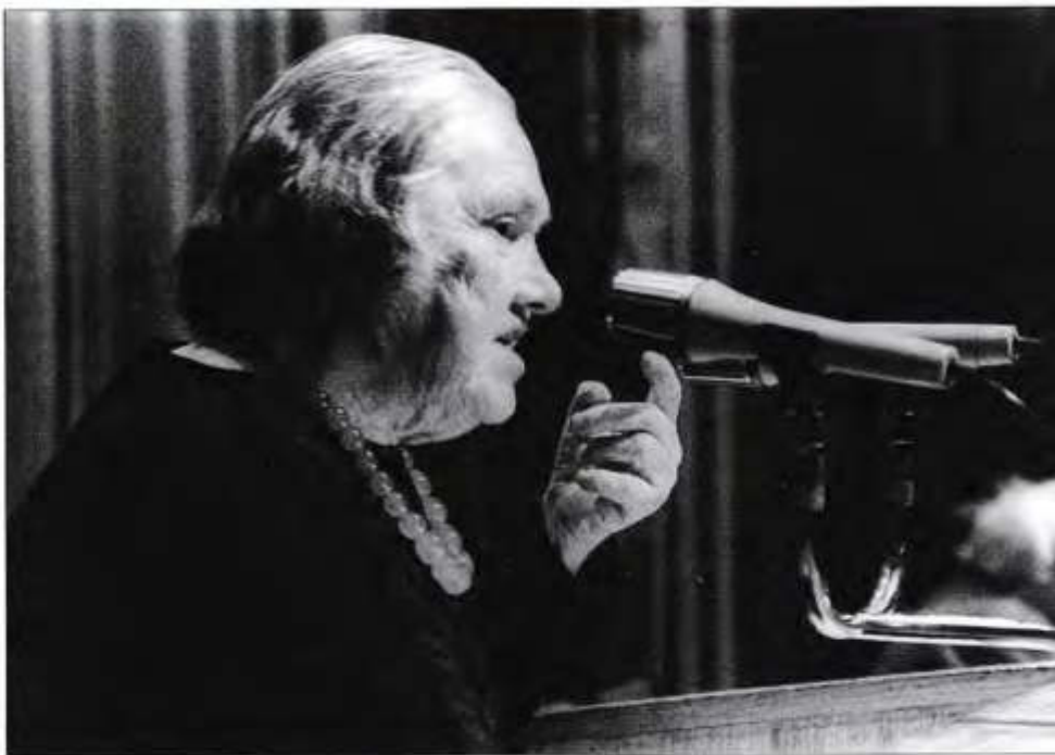
1989 год, выступление на форуме объединения «Московская трибуна»