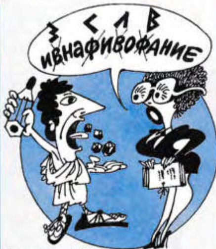
Рисунок Леонида НАСЫРОВА

ская девчонка захотела замуж за москвича. В этом нет ничего предосудительного.