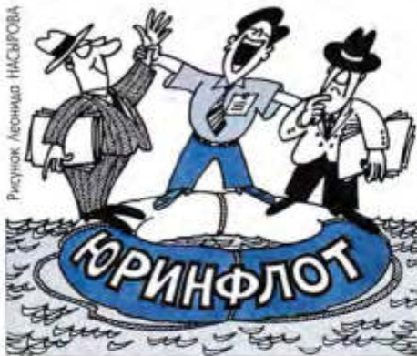
Рисунок Леонида НАСЫРОВА

Такая уж наша профессия – учиться приходится постоянно. И лучший учитель, на мой взгляд, это все-таки опыт.