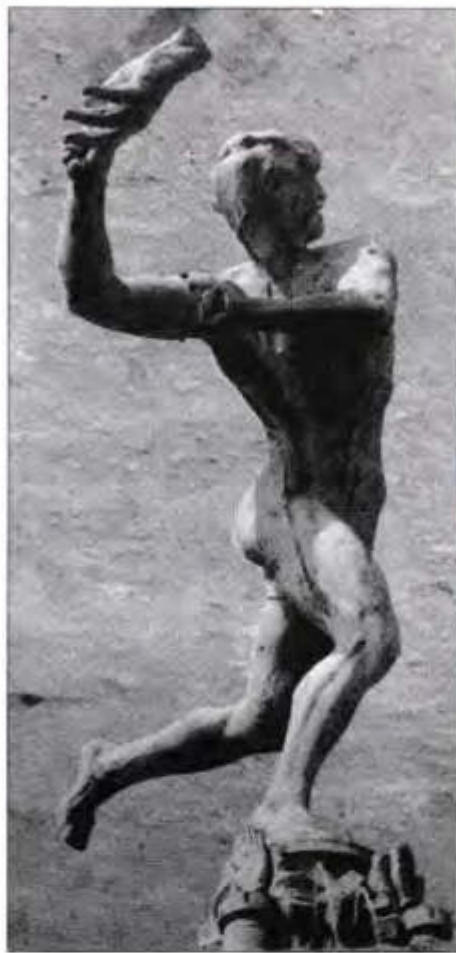
Памятник Сильвиусу Брабо в Антверпене