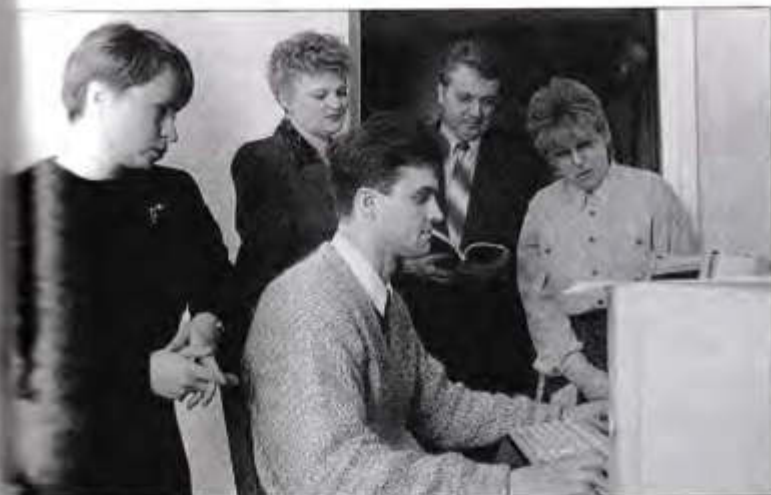
Адвокаты юридической консультации «Центр-консультант»

стенку приходится трудиться без выходных, сокращать отпуск, прихватывать вечерние часы.