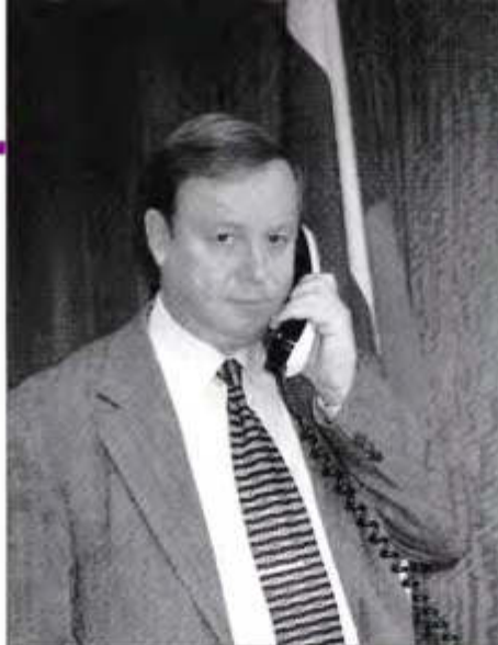
Сергей Степашин «Обретение надежд» стр. 4–6

«К моему удовлетворению не подтвердилось расхожее суждение об адвокатах как о людях, которые думают лишь о том, чтобы побольше набить себе карманы деньгами».