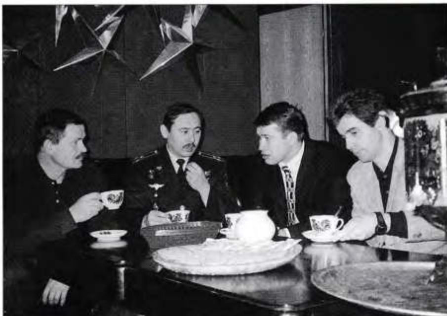
Чашепитие в «Звездном»