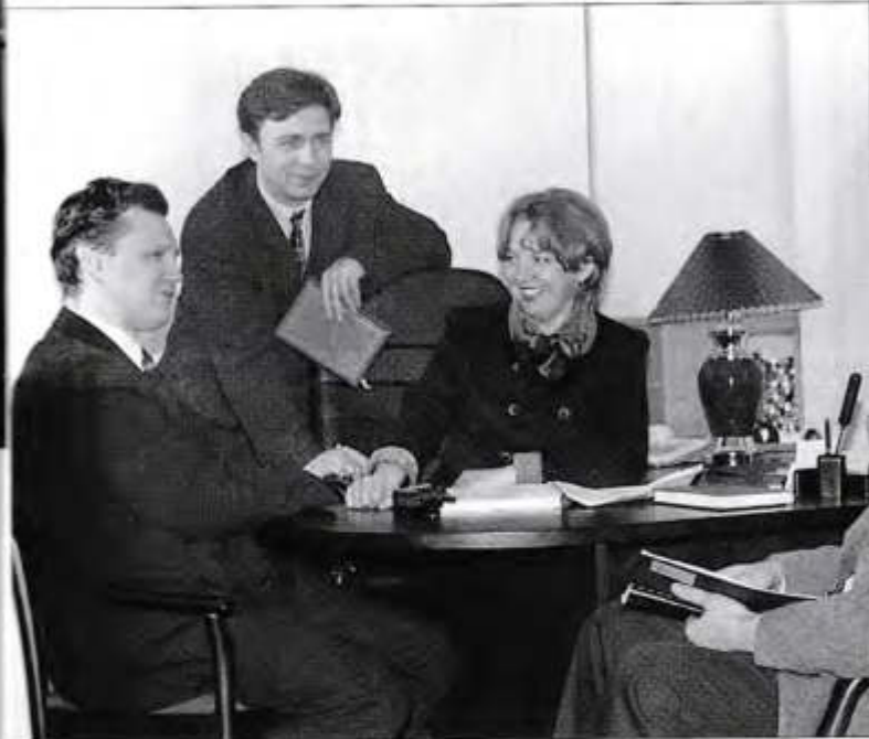
Коллеги сразу понимают друг друга