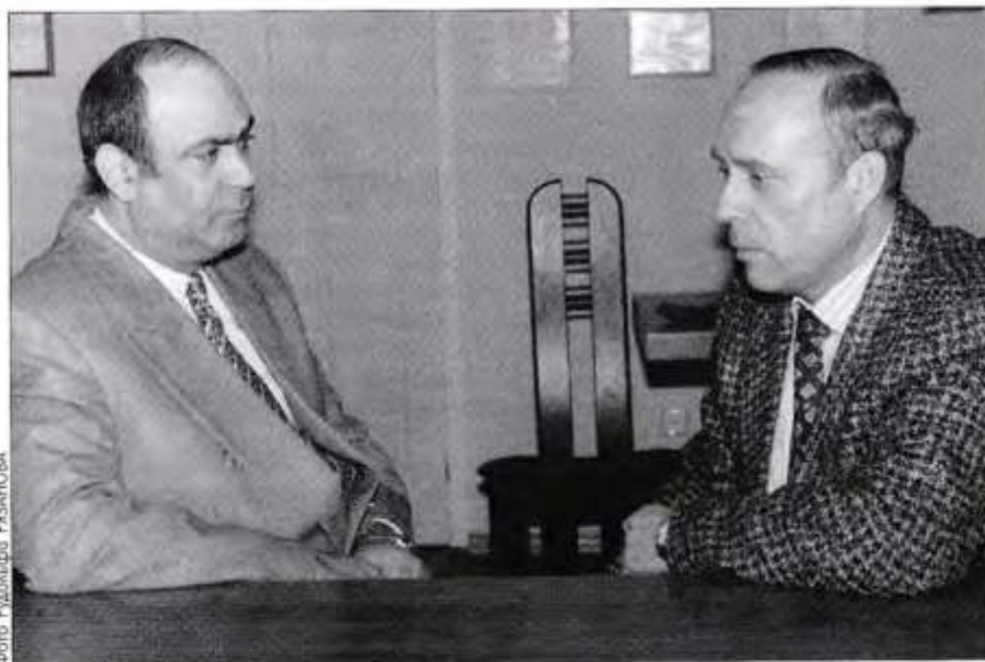
Гасан МИРЗОЕВ, президент Гильдии российских адвокатов