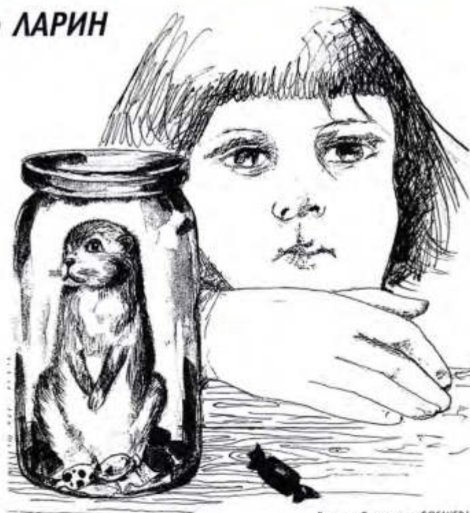
Рисунок Владимира БОГАЧЕВА

В доме праздник. Мама купила дочке Фомку. Фомка неподвижно сидит в банке, и только бусинки глаз выдают в нем любопытство к окружающему его шуму.