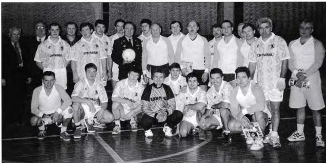
Матч окончен. Фото на память

– Бортинженер Николай Бударин, Герой России, летчик-космонавт. Сорок четыре года. В отряд пришел в восемьдесят девятом. До этого почти тринадцать лет работал в РКД «Энергия» инженером, ведущим инженером, руководителем группы по испытанию космической техники. Первый полет совершил в девяносто пятом году вместе с командиром Анатолием Соловьевым. Мы стартовали с американского мыса Канаверал в составе экипажа «Шаттла», после чего была стыков-