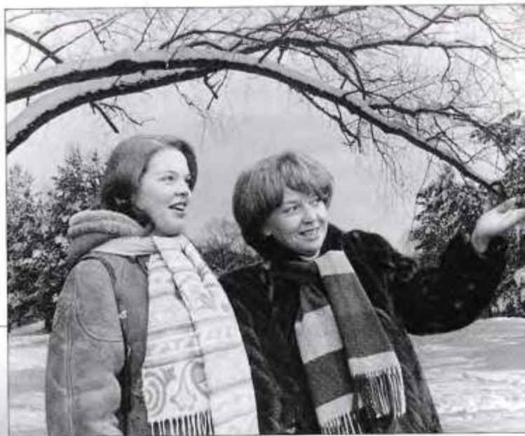
Хорошо в свободную минуту побывать с дочерью