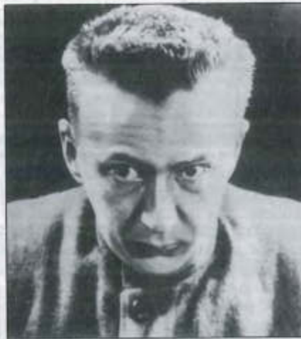
А.КЕРЕНСКИЙ. 1917 г.