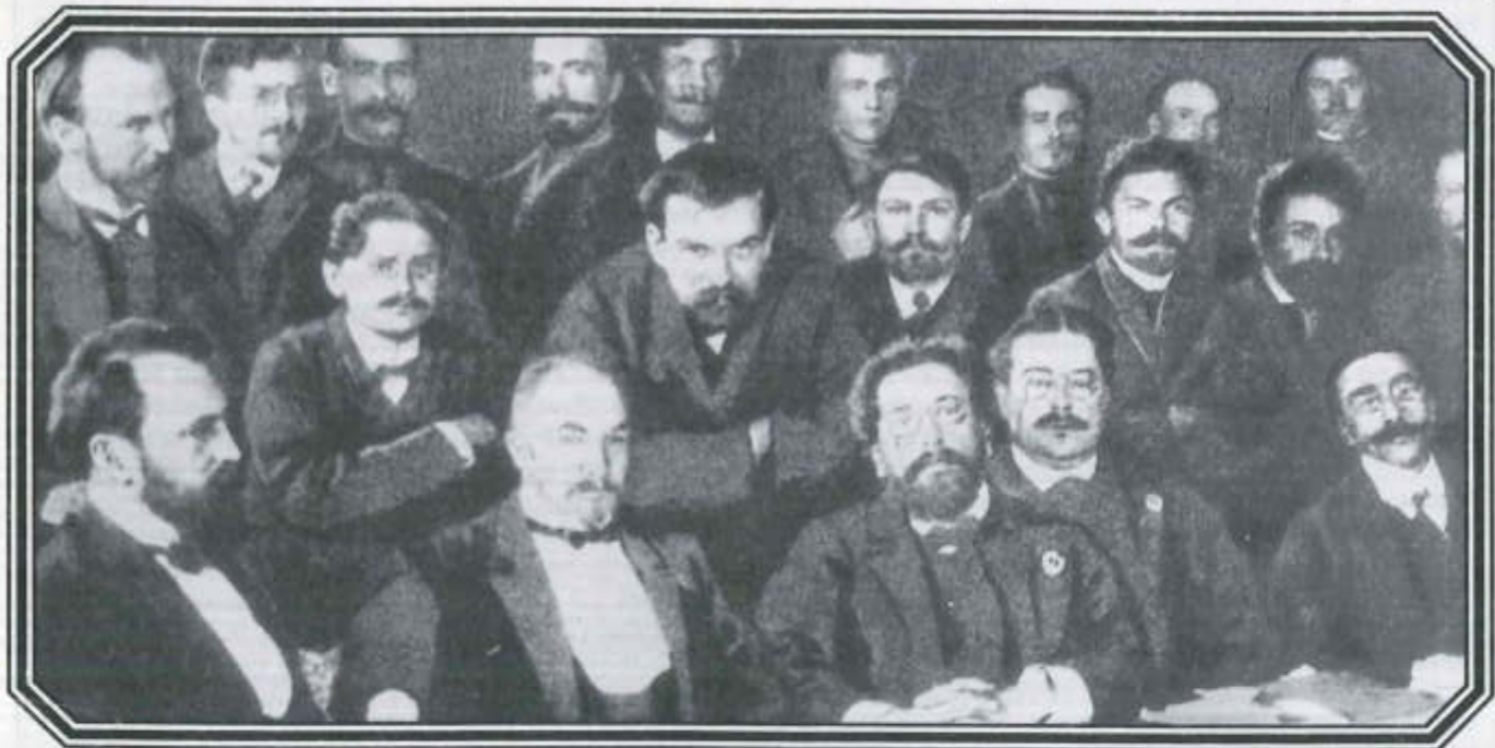
П.МАЛЯНТОВИЧ (в первом ряду второй слева) в перерыве одного из судебных процессов. 1906 г.

Но прежде, чем приступить к рассказу, отмечу, что в биографии моего деда, как в зеркале, отразилась судьба той части русской либеральной интеллигенции, которая, увлеченная идеями служения народу, встала на путь революционной борьбы и оказывала посильную помощь