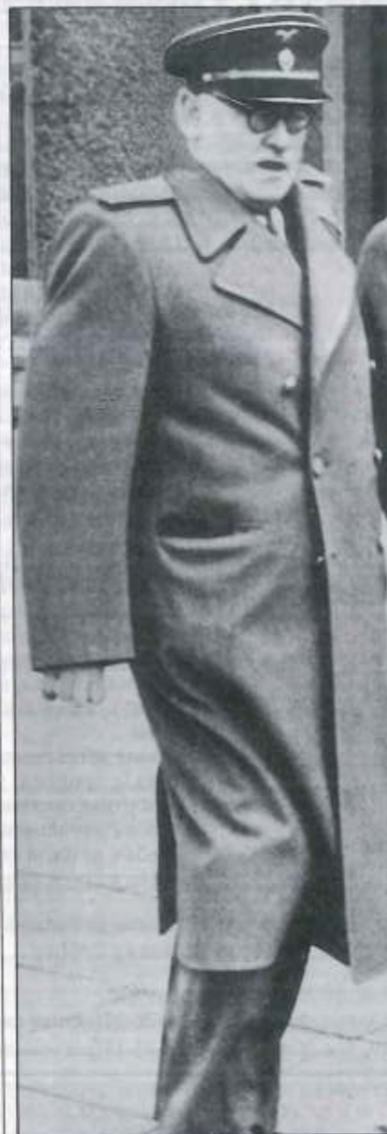
А.ВЫШНСКИЙ. 1945 г.