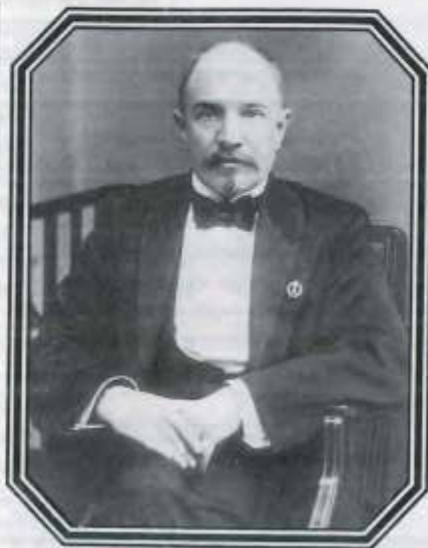
Павел Николаевич МАЛЯНТОВИЧ

Одним из знаменитейших дел деду было дело о так называемом морозовском наследстве. В 1906 году скончавшийся с собой промышленник Савва Морозов завещал 100 000 рублей партии большевиков. Они, как известно, в то время находились в подполье, а часть руководства во главе с Лениным – в эмиграции. Слож-