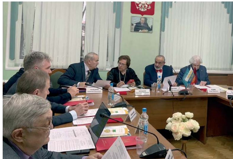
Заседание Комитета, 14.11.2023г.